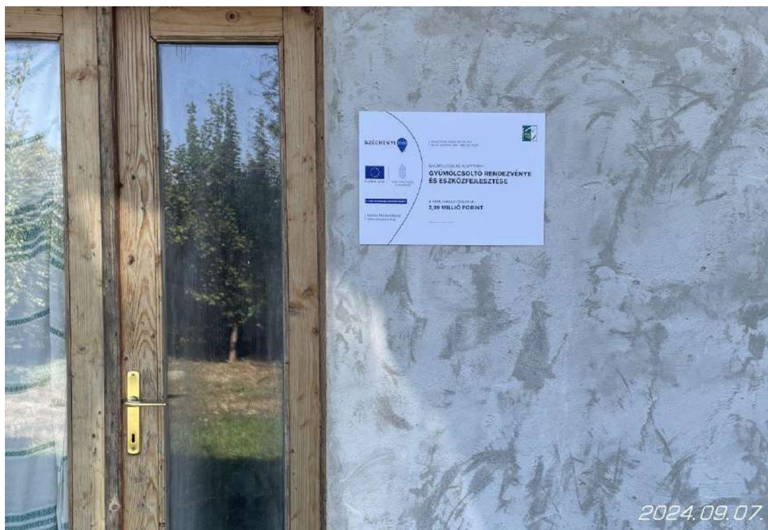
Projekttábla a székhely bejáratánál