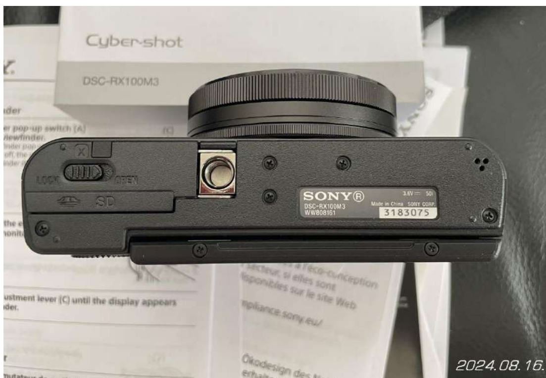
Egyedi azonosító a fényképezőgép alján