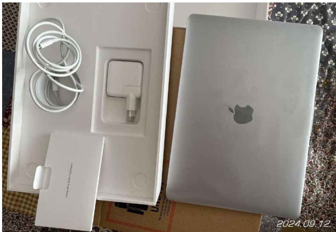
Apple MacBook Air laptop kicsomagolása