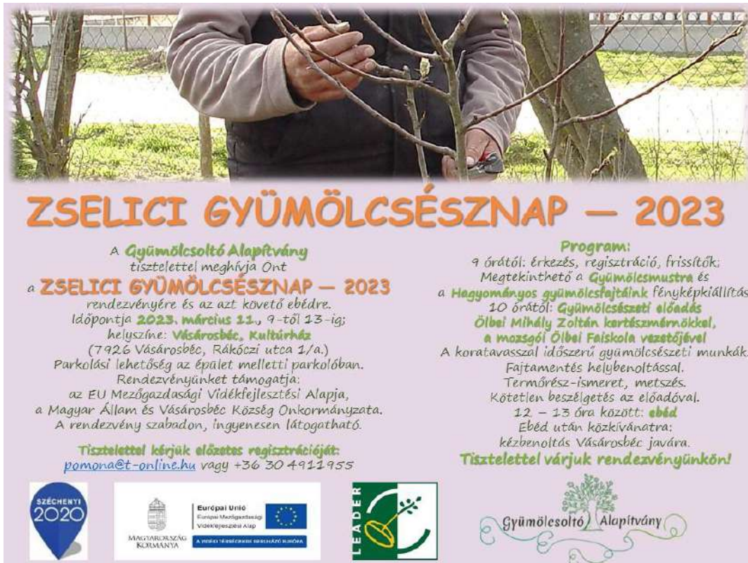
A rendezvény plakátja