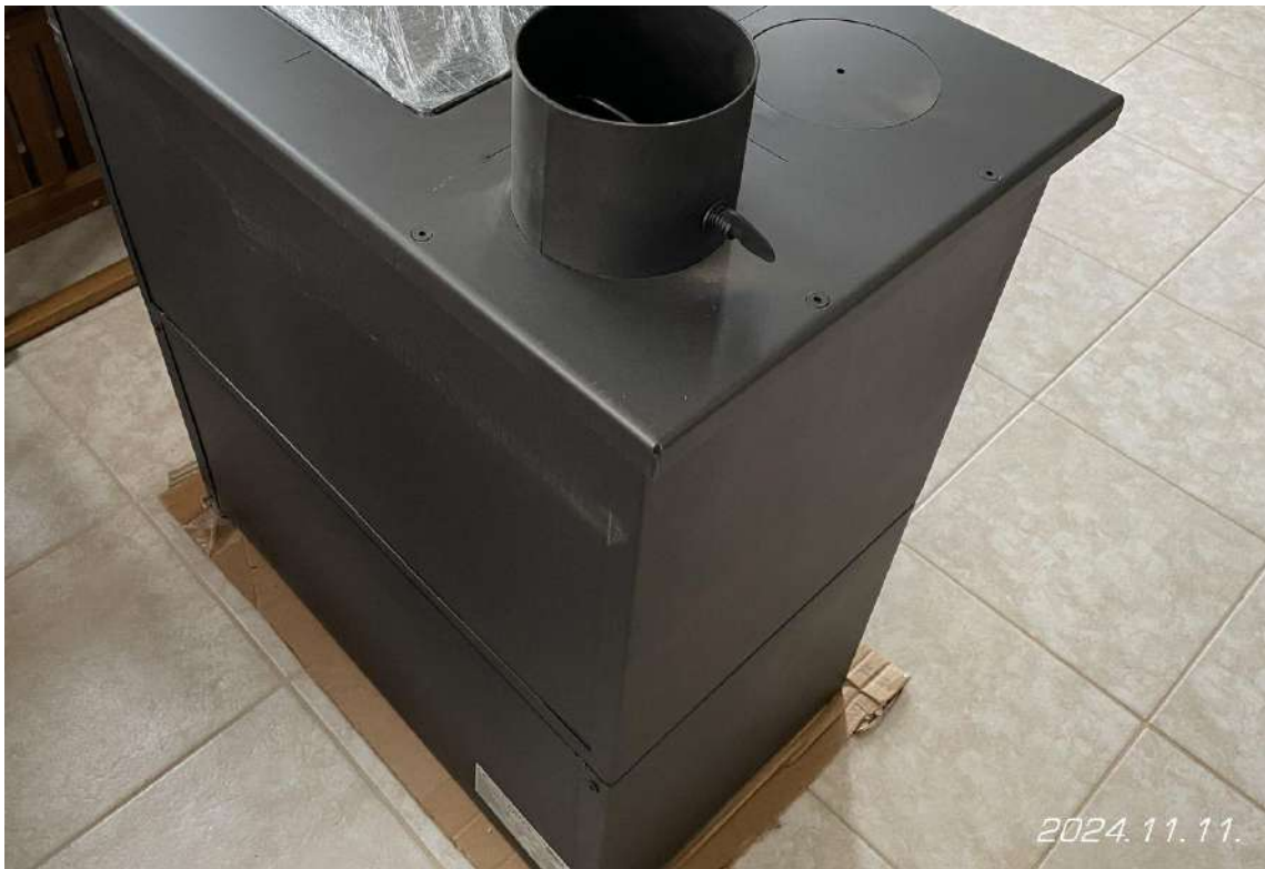
A tűzhely hátulról