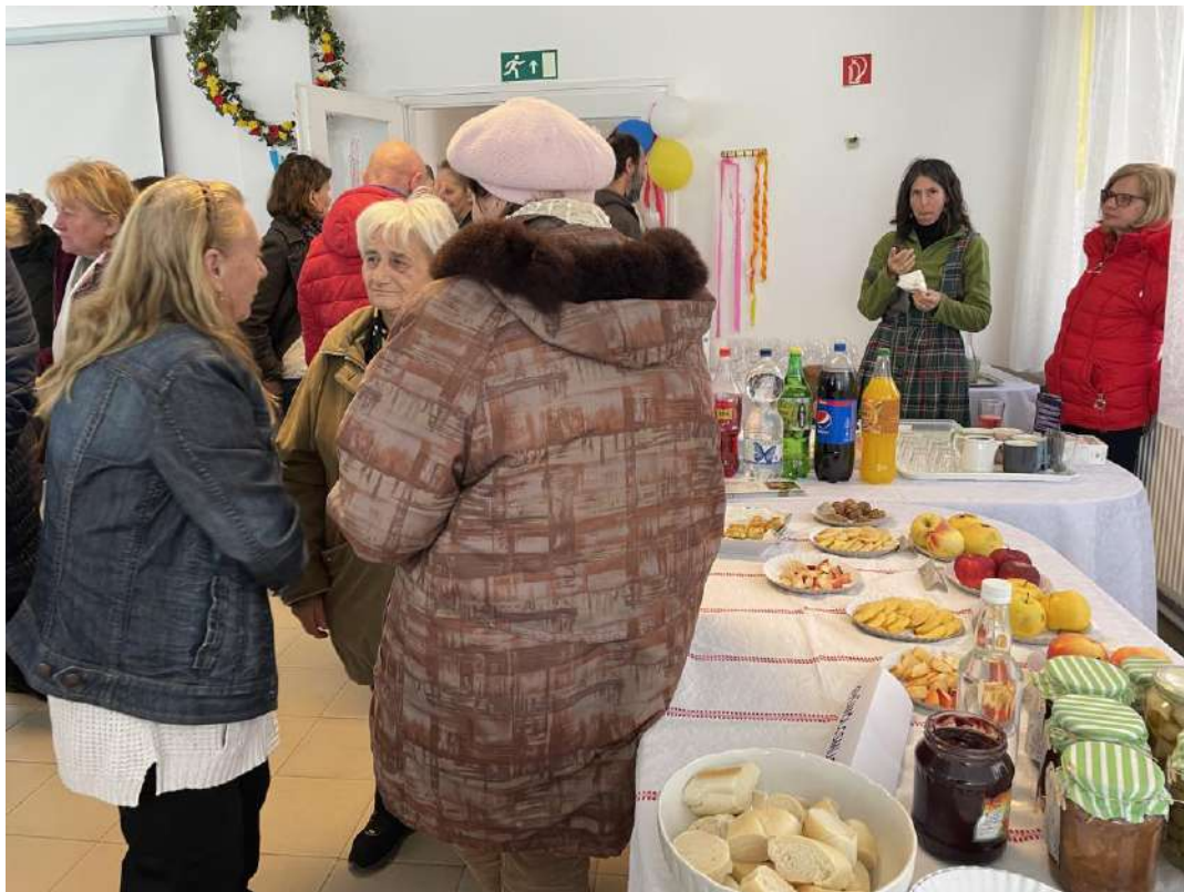
Ebéd előtti eszmecsere