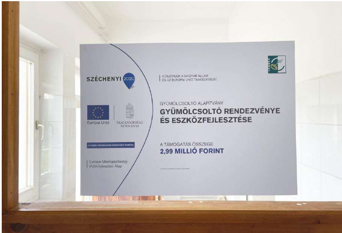
Tájékoztató tábla a rendezvényen