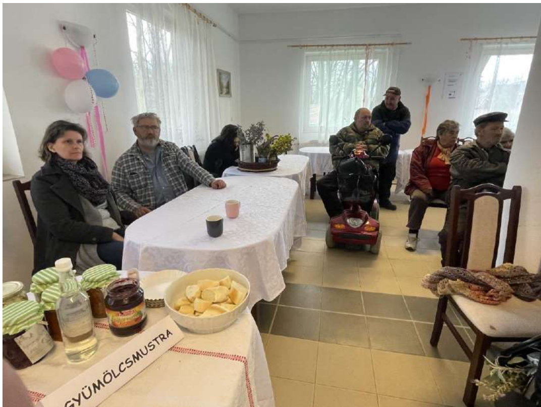
A figyelő hallgatóság egy része