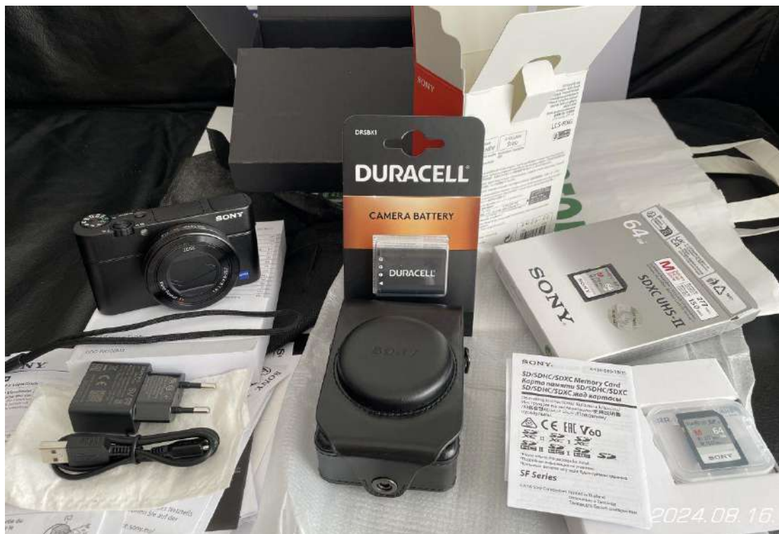
Sony DSC-RX100M3 fényképezőgép tartozékokkal