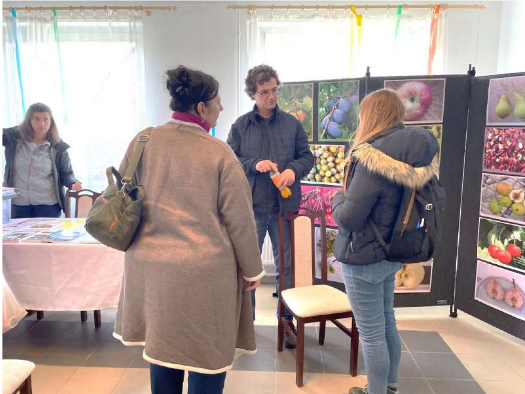
Konzultáció az előadóval