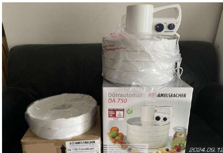
Aszaló két póttálcával