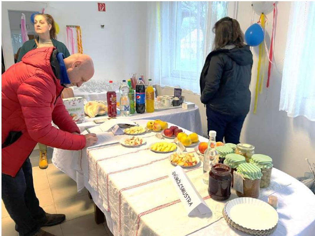
Gyümölcsmustra és gyülekező