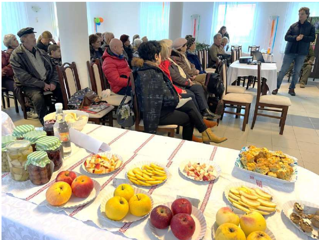
Kezdődik az előadás