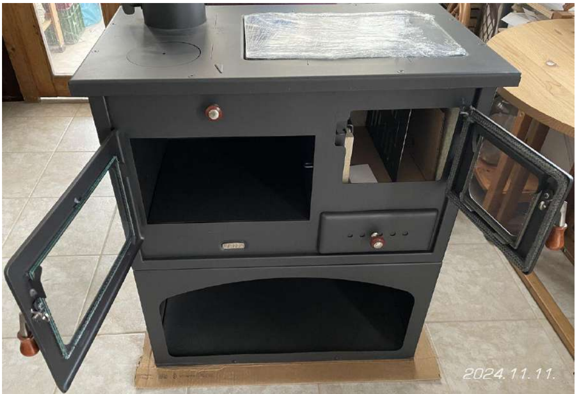
A kicsomagolt tűzhely