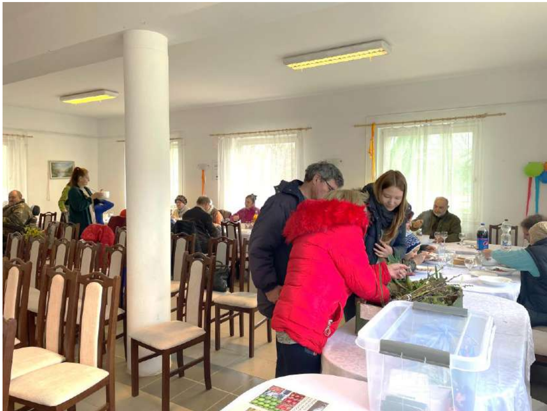
Az ebéd felszolgálása, növények csereberéje és szakkönyv-bemutató