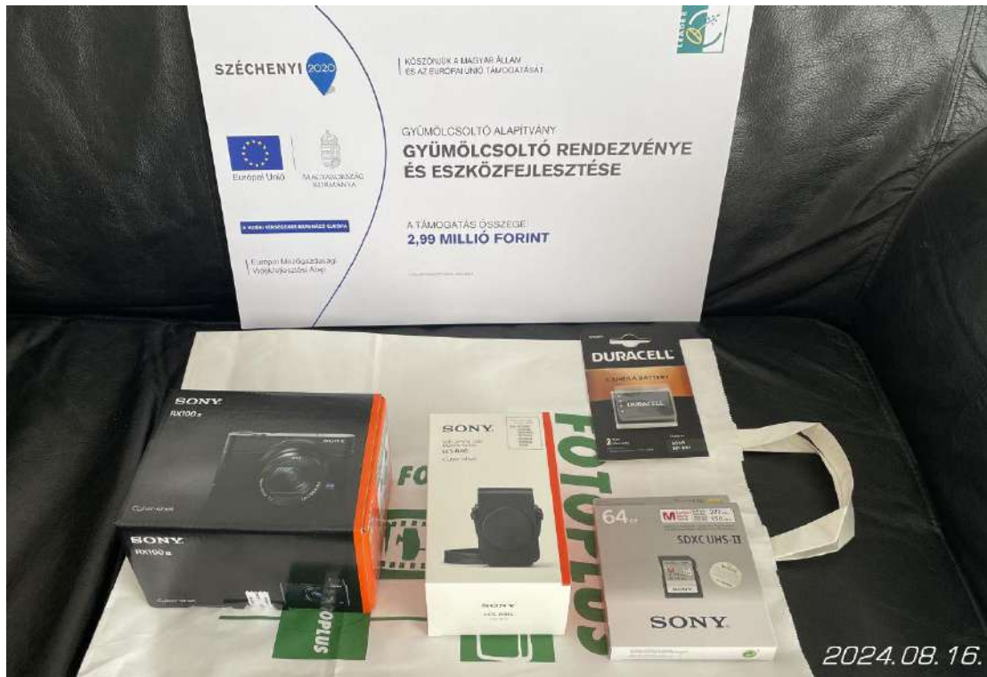
Sony DSC-RX100M3 fényképezőgép tartozékokkal a projekttáblával