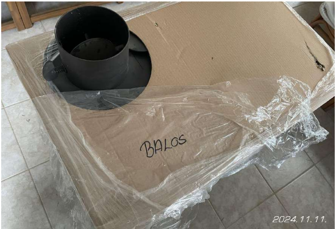
A tűzhely kicsomagolása