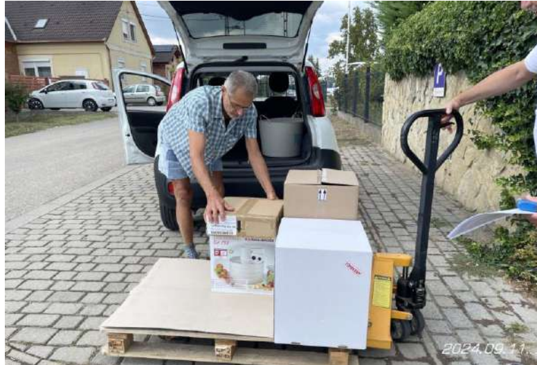
Gyümölcsstartósító berendezés szett átvétele