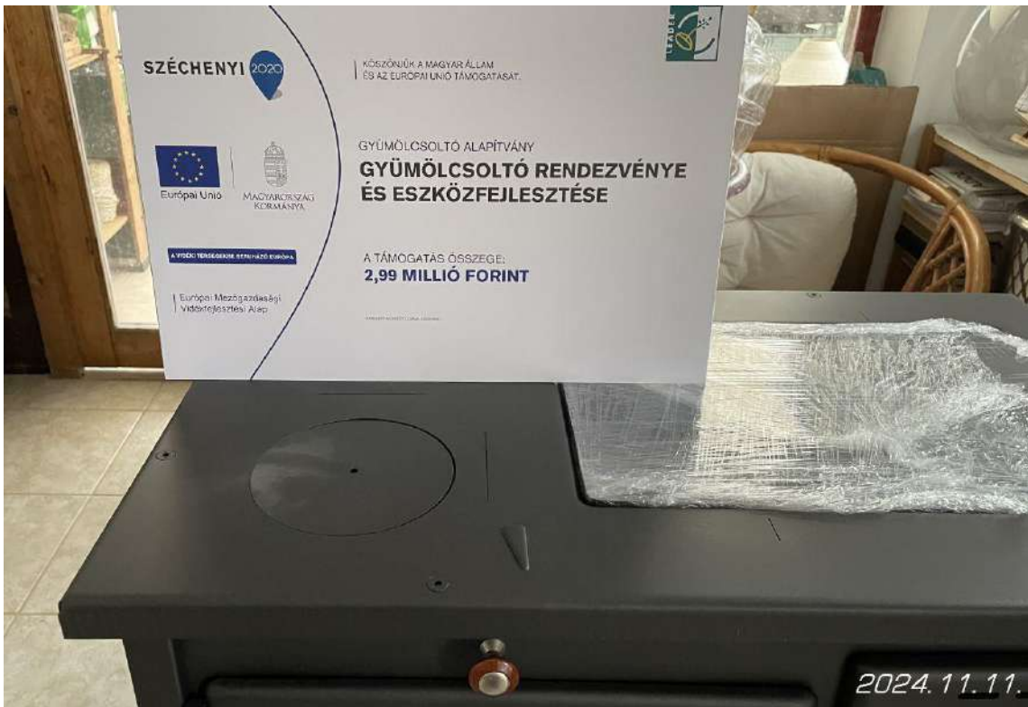
A tűzhely a projekttáblával