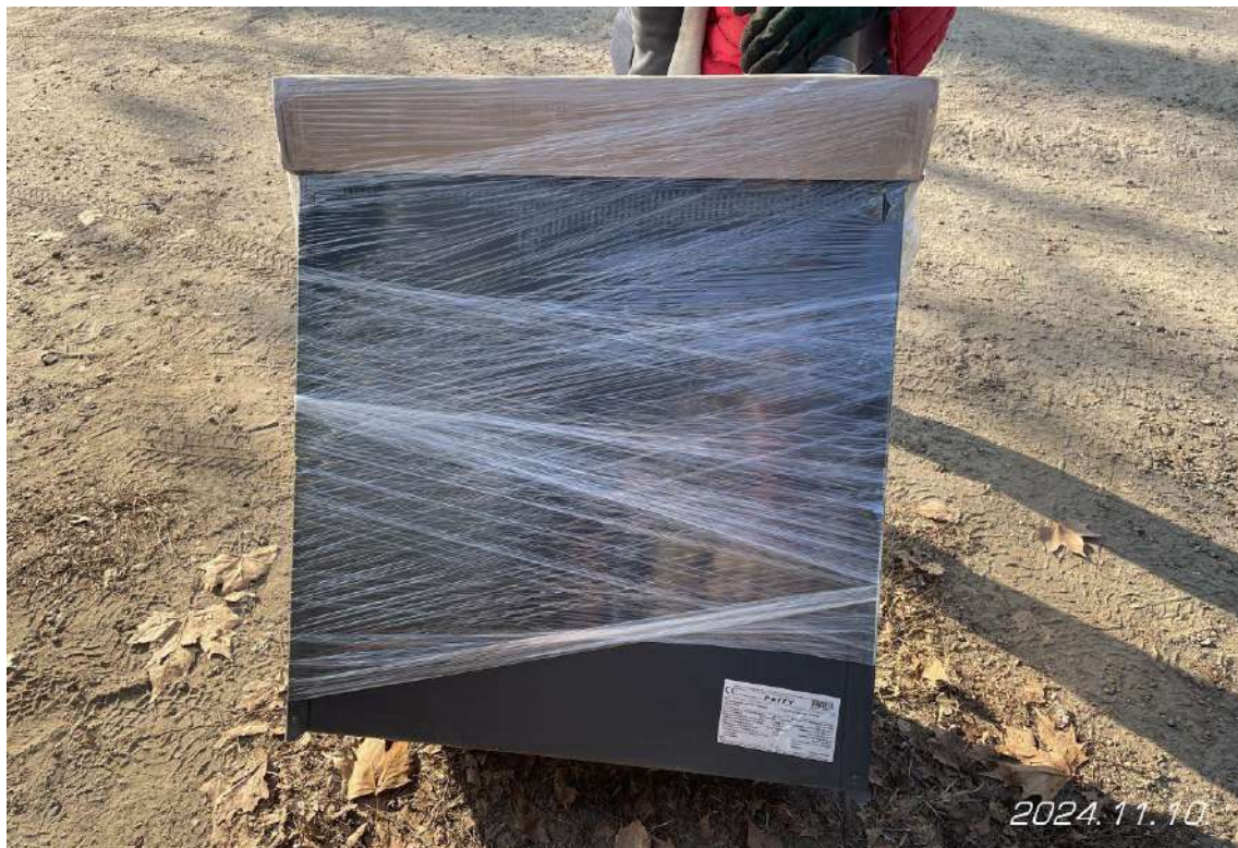
A becsomagolt tűzhely a CE adattáblával