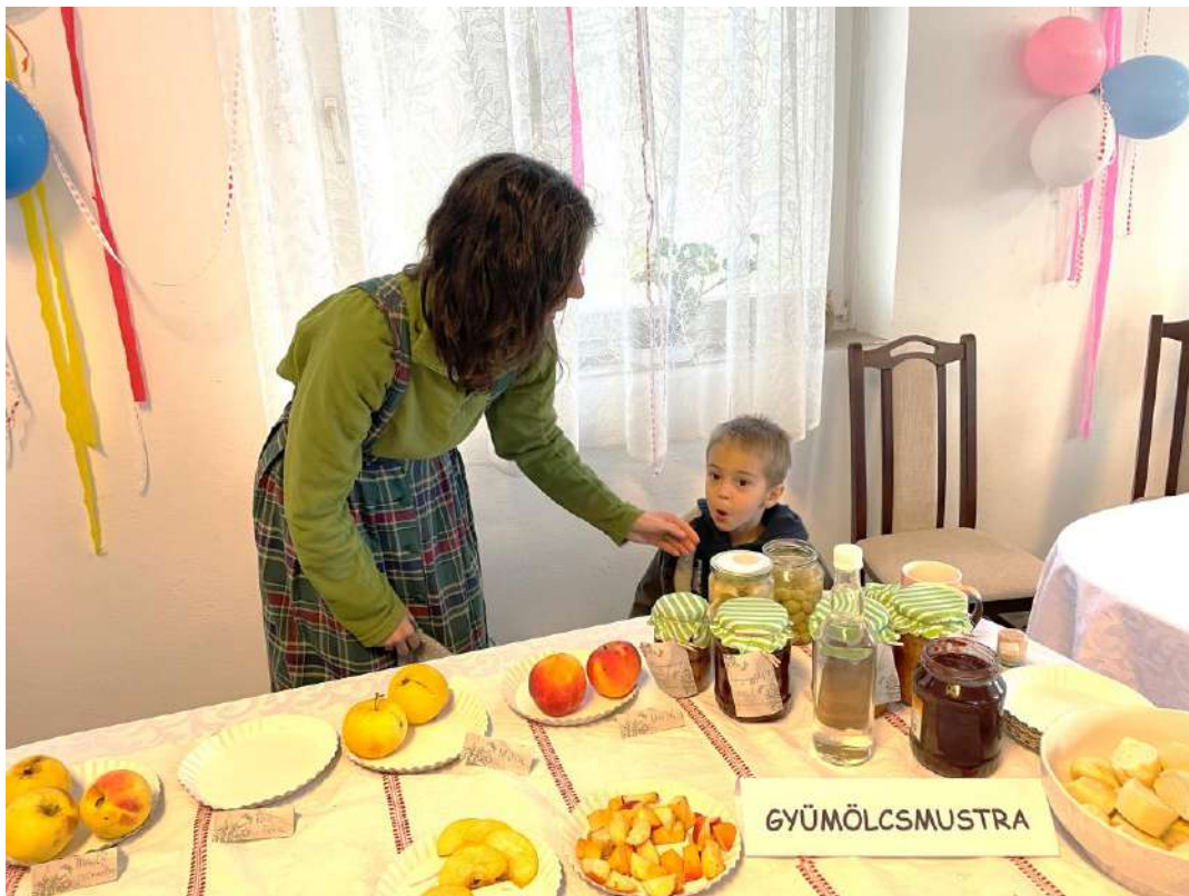
A legifjabb gyümölcsész az előadáson