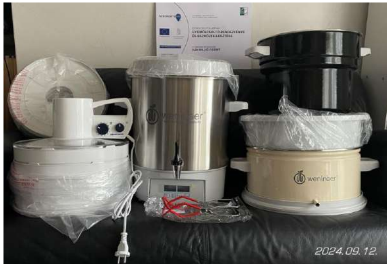
Gyümölcsstartósító berendezés szett a projektábrával