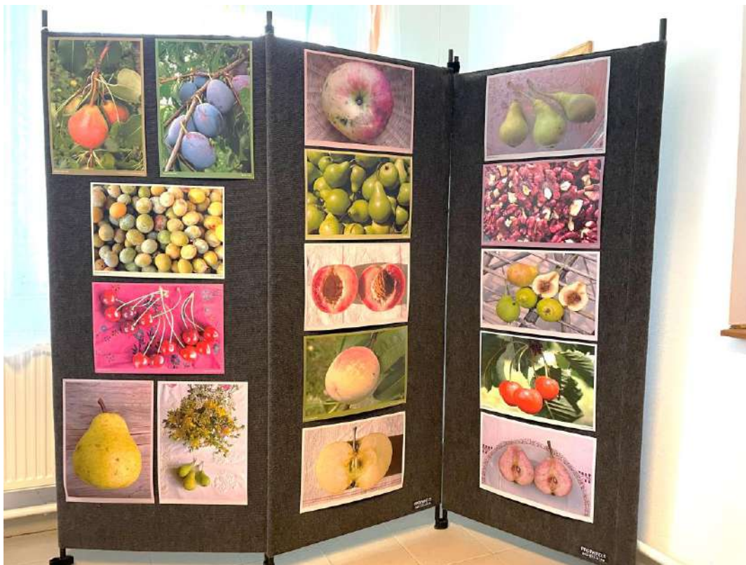
A Hagományos gyümölcseink című fényképkiallítás