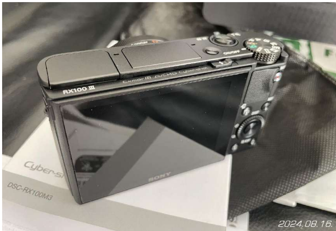
Sony DSC-RX100M3 fényképezőgép