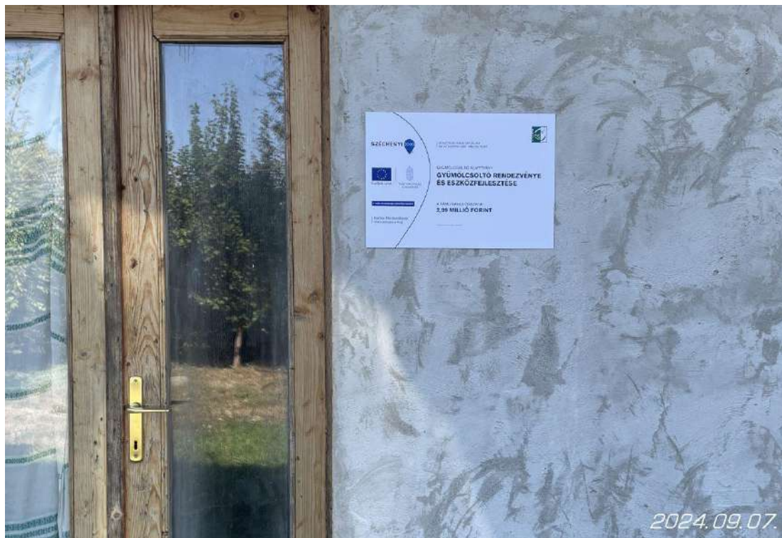
Projekttábla a székhely bejáratánál