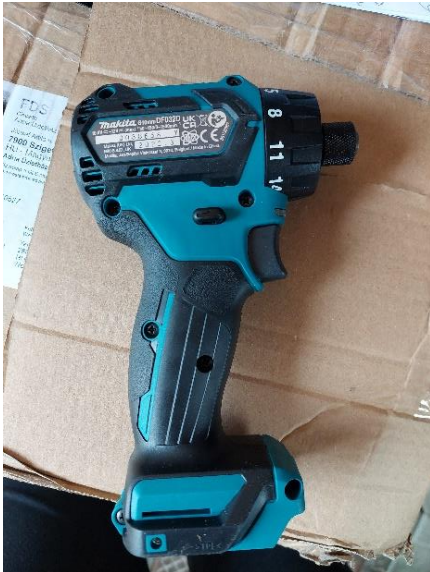
Makita Akkus csavarbehajtó DF032D