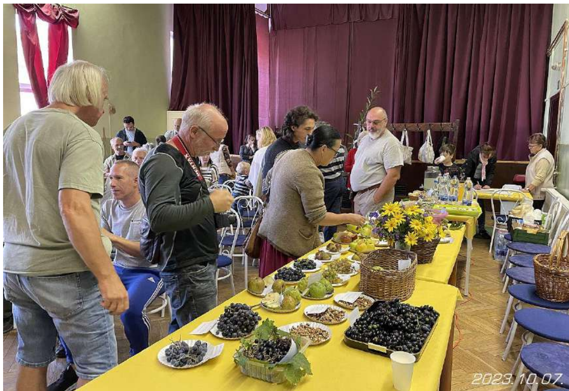
Gyümölcsmustra a látogatókkal