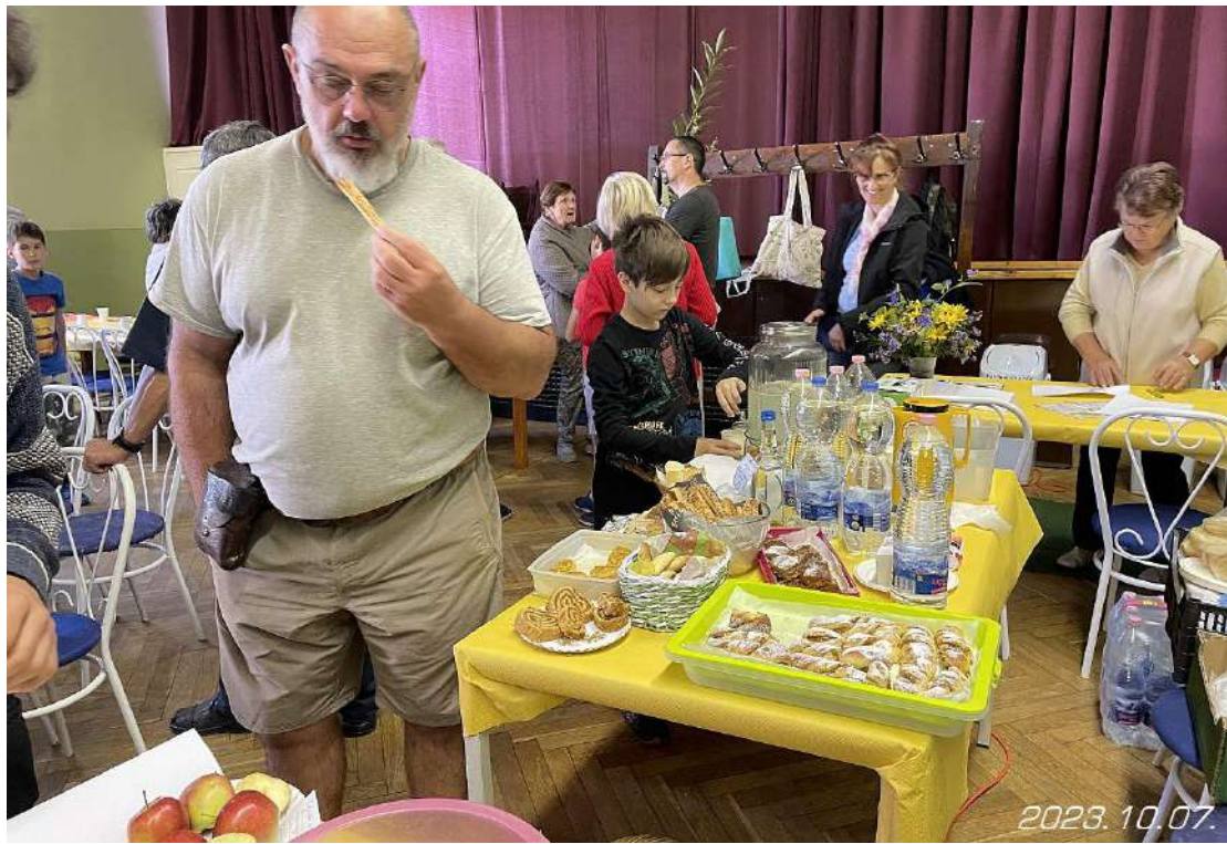
Catering: a büféasztal