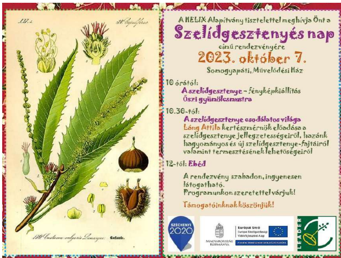
A rendezvény plakátja