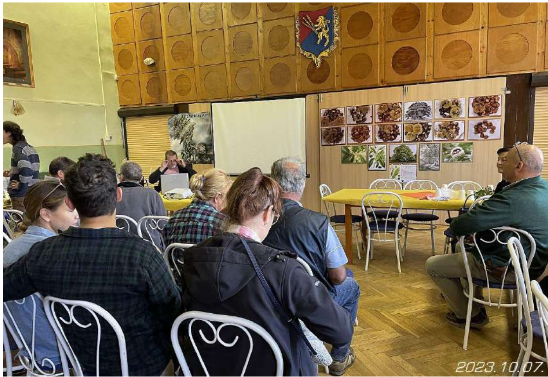
Hamarosan kezdődik az előadás