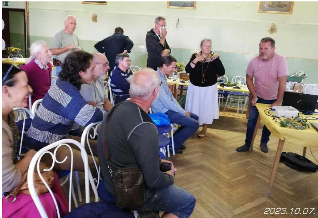
Kötetlen beszélgetés az előadóval