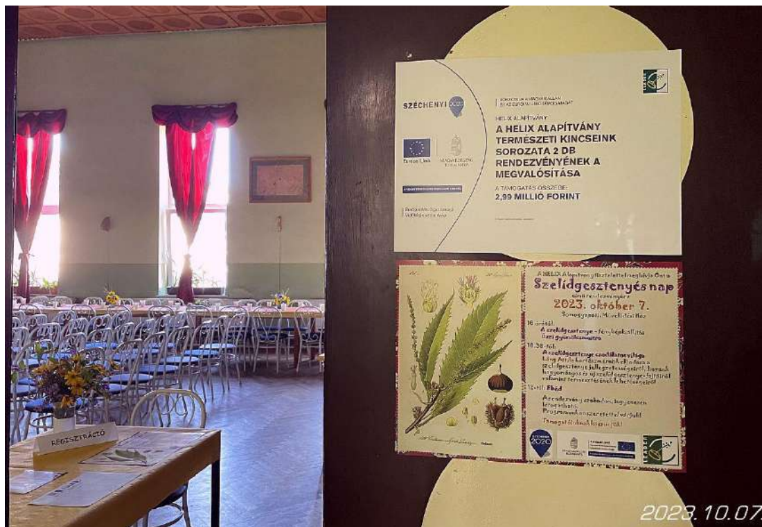
Tájékoztató tábla és plakát a terem bejáratánál