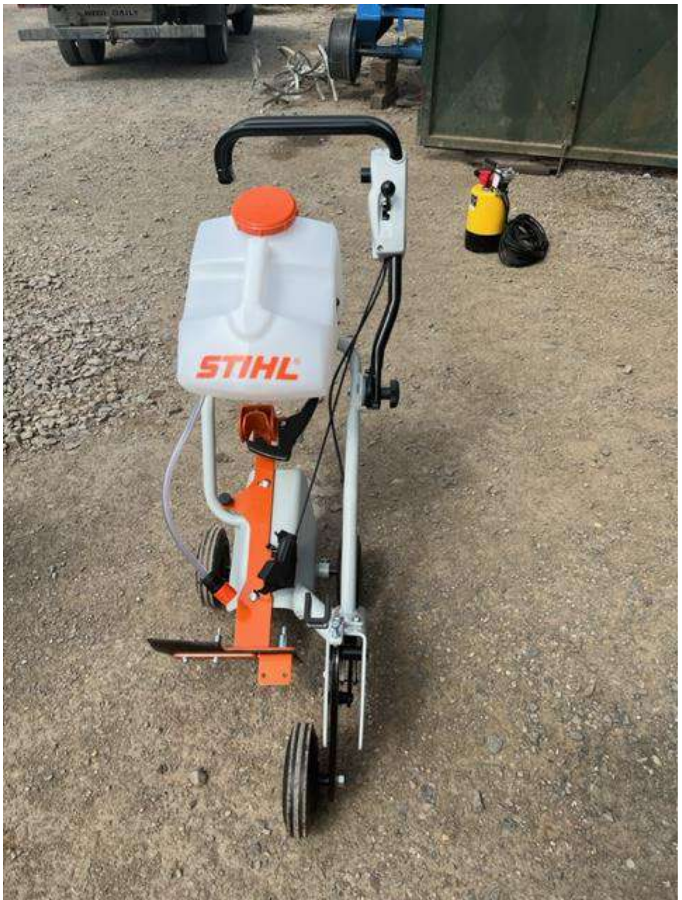
Stihl TS 800 Vágótárcsás gép és tartozék szett – 3-3 db