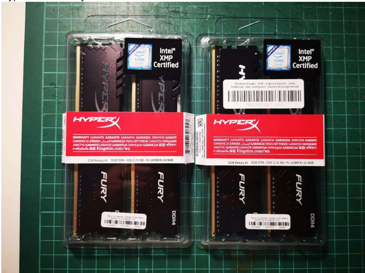
HyperX 32GB Fury DDR4 3200 MHz Memória