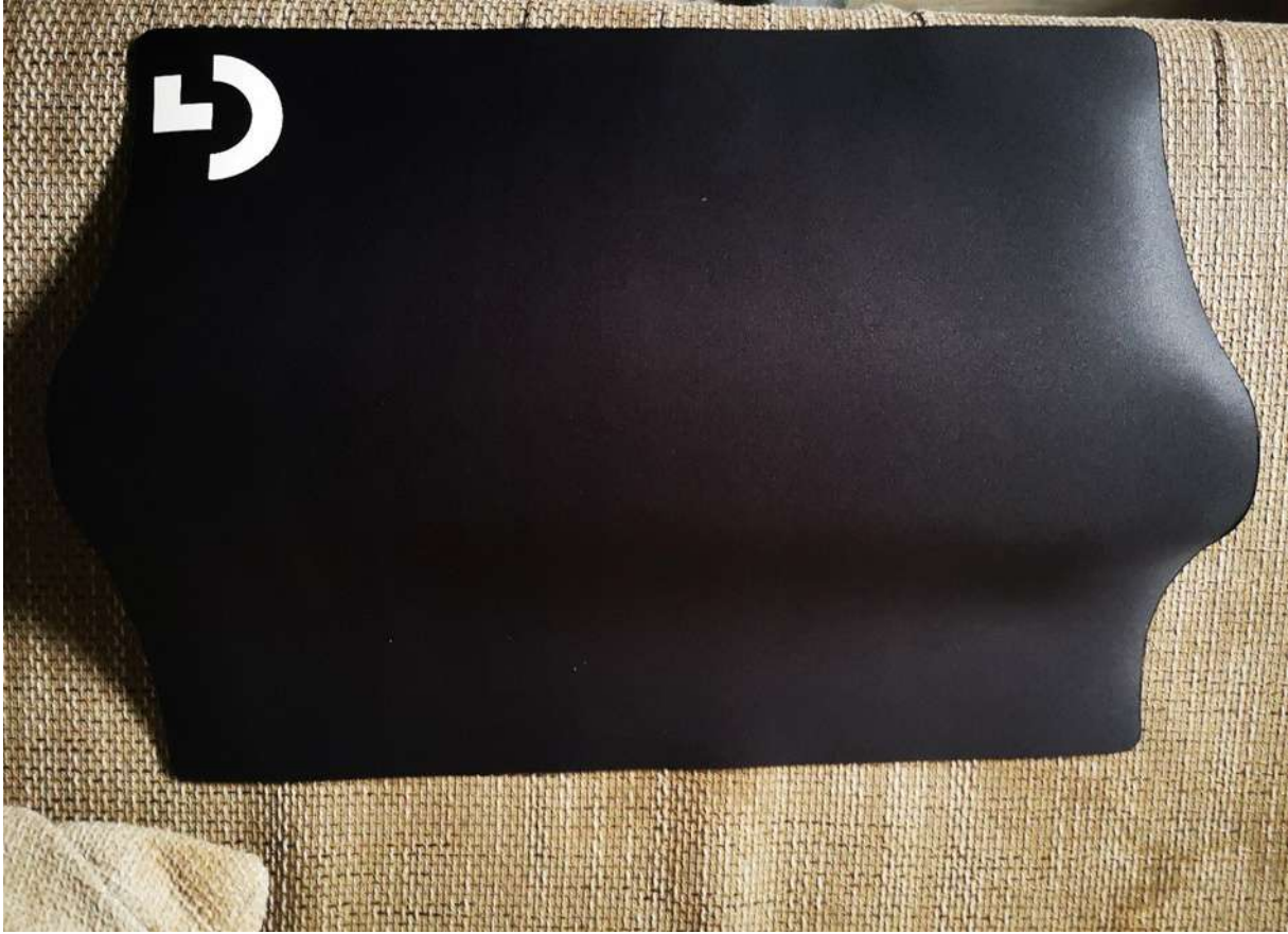
Synology Diskstation DS420+