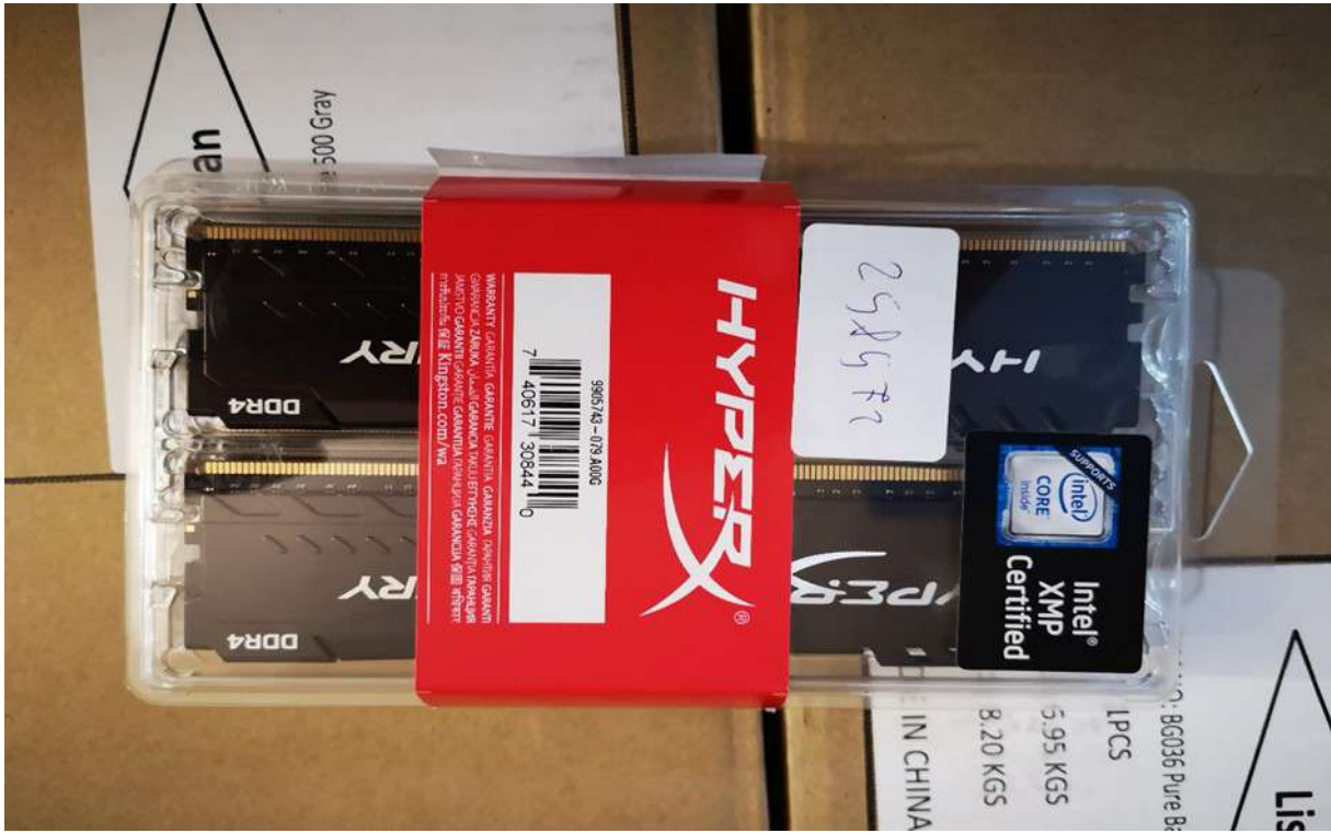
HyperX 32 GB Fury DDR Memória