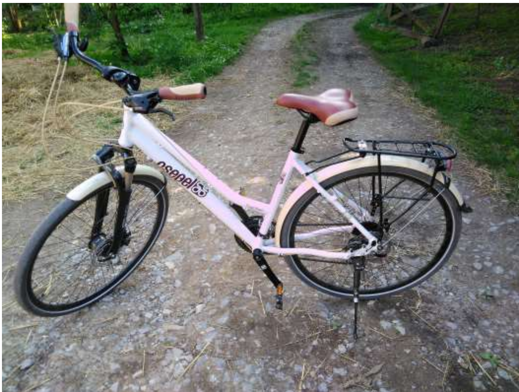
Csepel Traction 300 női kerékpár