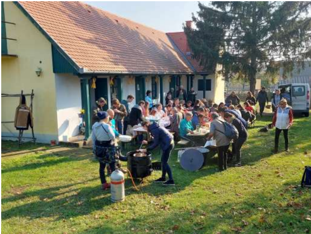
2022.10.30. Projektzáró rendezvény Vásárosbéc-Szentlászló