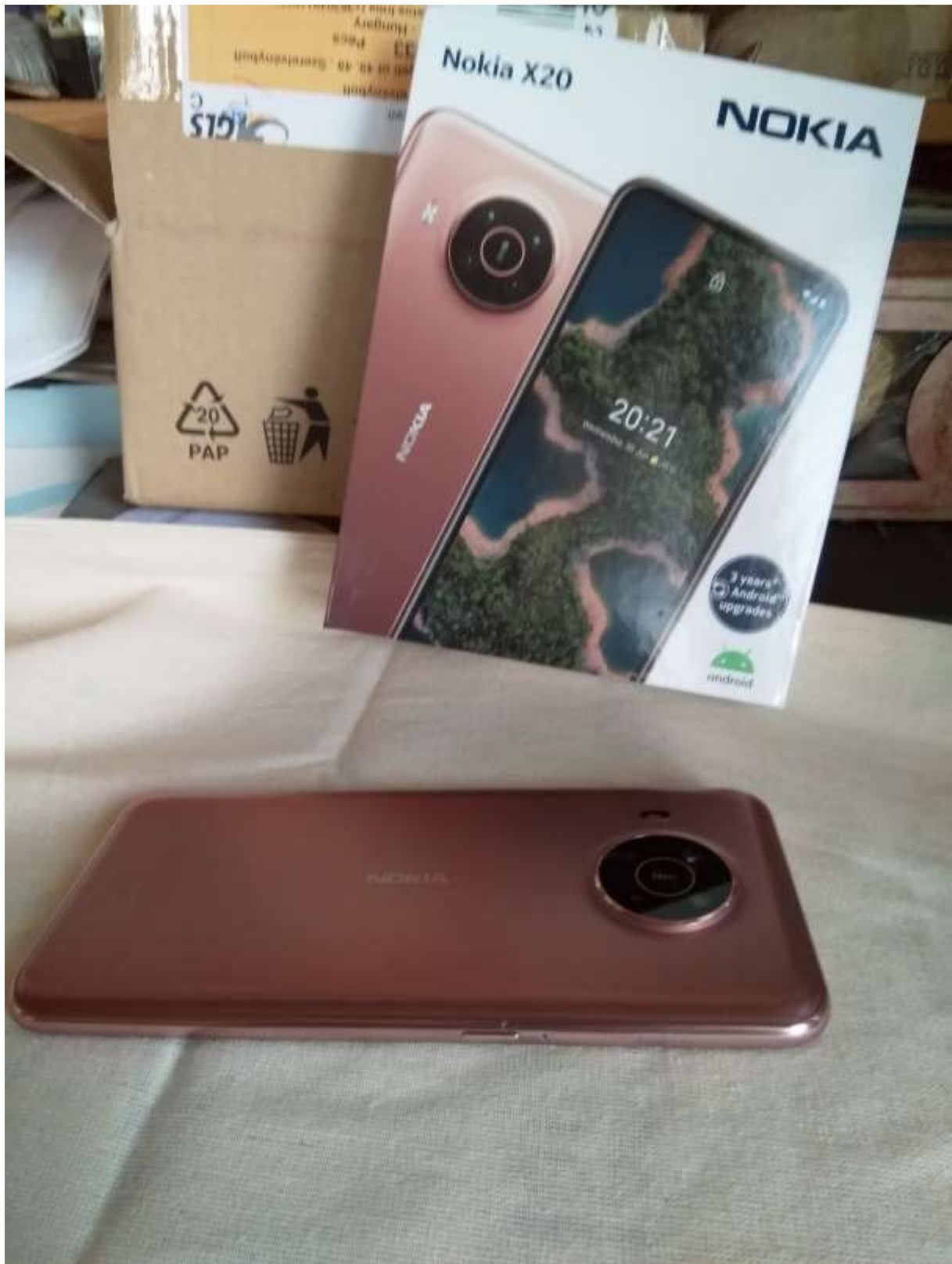
Gyümölcsoltó Mokia okostelefon