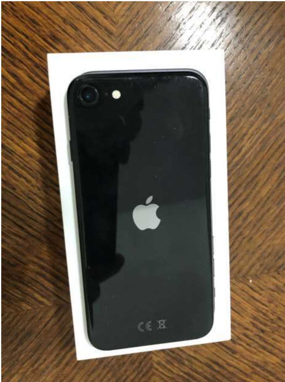
Apple iPhone SE 128 GB okostelefon