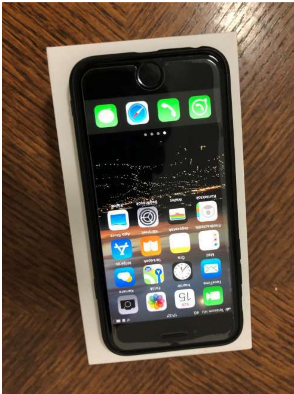
Apple iPhone SE 128 GB okostelefon