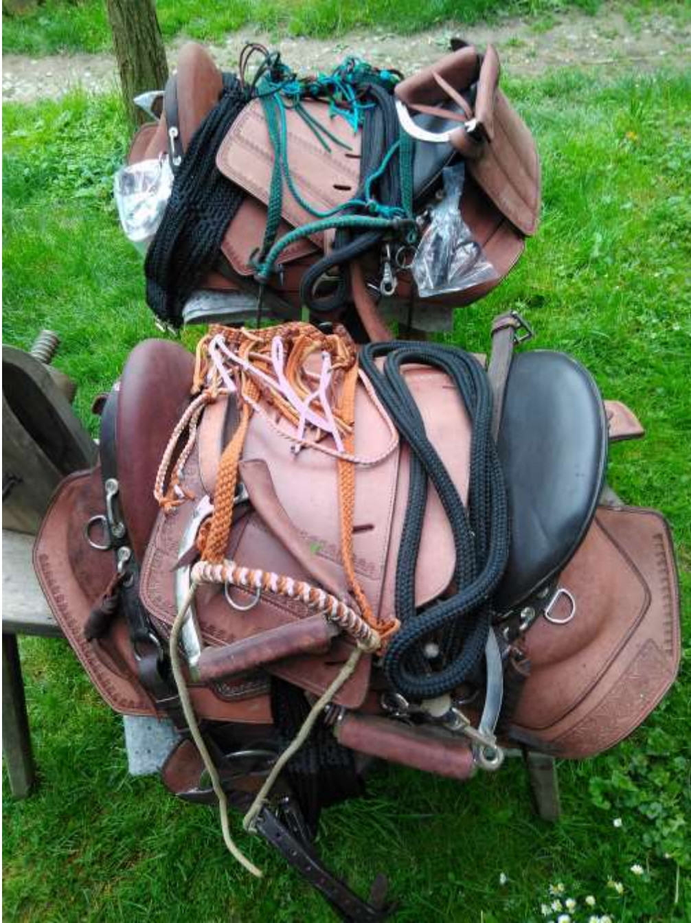
Escape fouganza túranyereg szett 1-2.