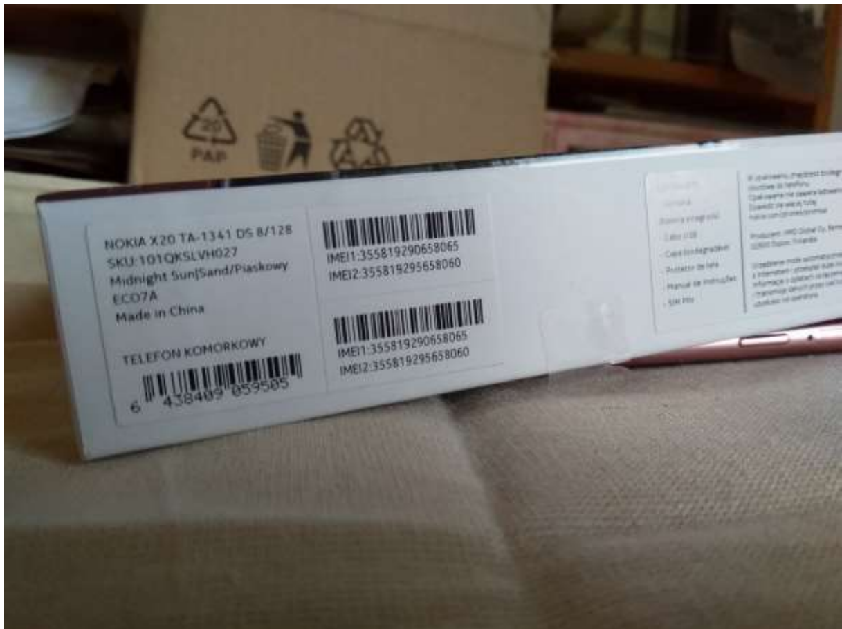
Gyümölcsoltó Nokia okostelefon doboza