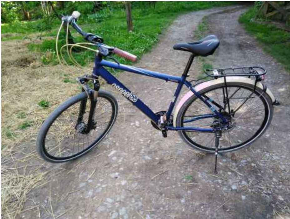
Csepel Traction 300 férfi kerékpár