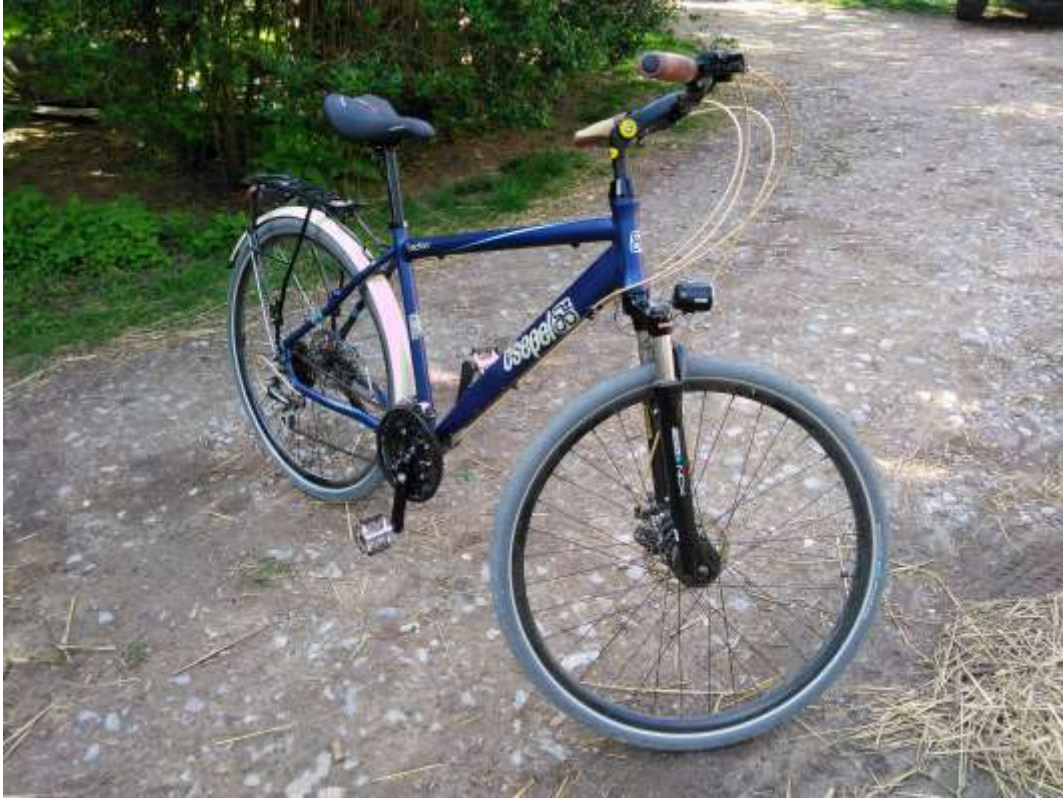
Csepel Traction 300 férfi kerékpár