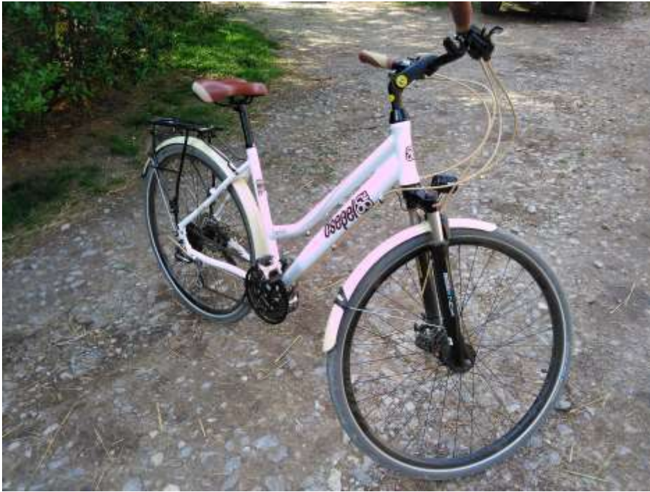
Csepel Traction 300 női kerékpár