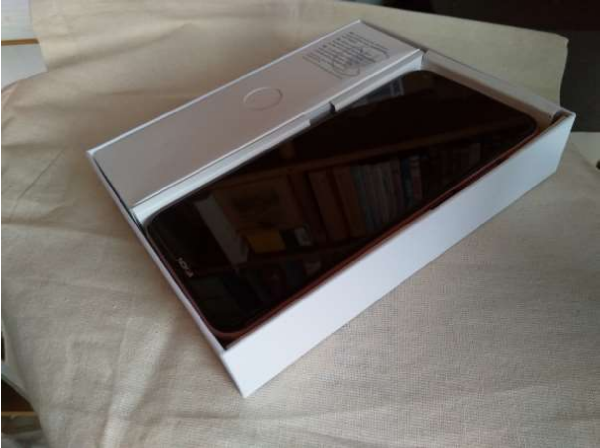
Gyümölcsoltó Nokia okostelefon 2.