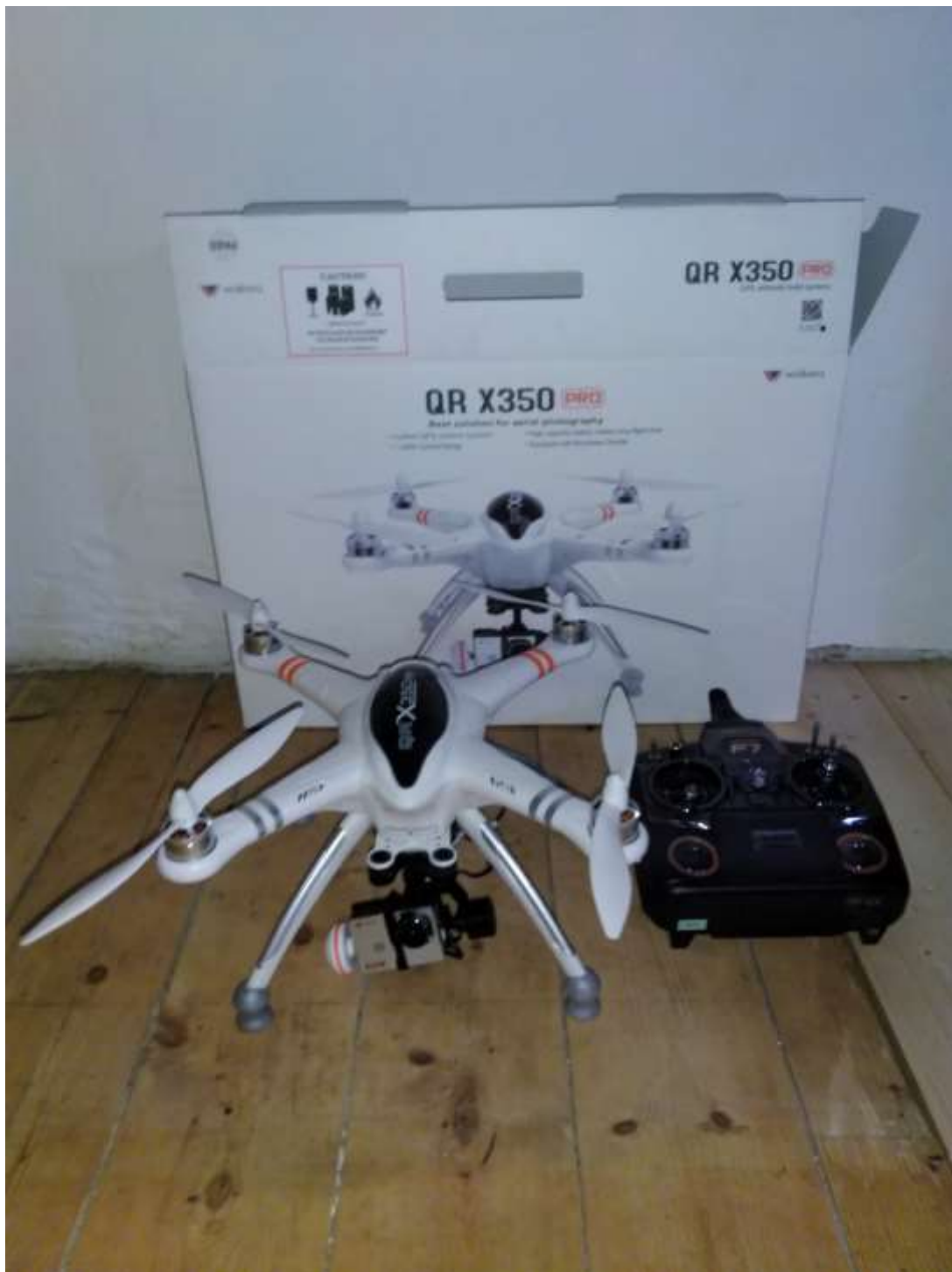
Walkera QRX 350 PRO drón