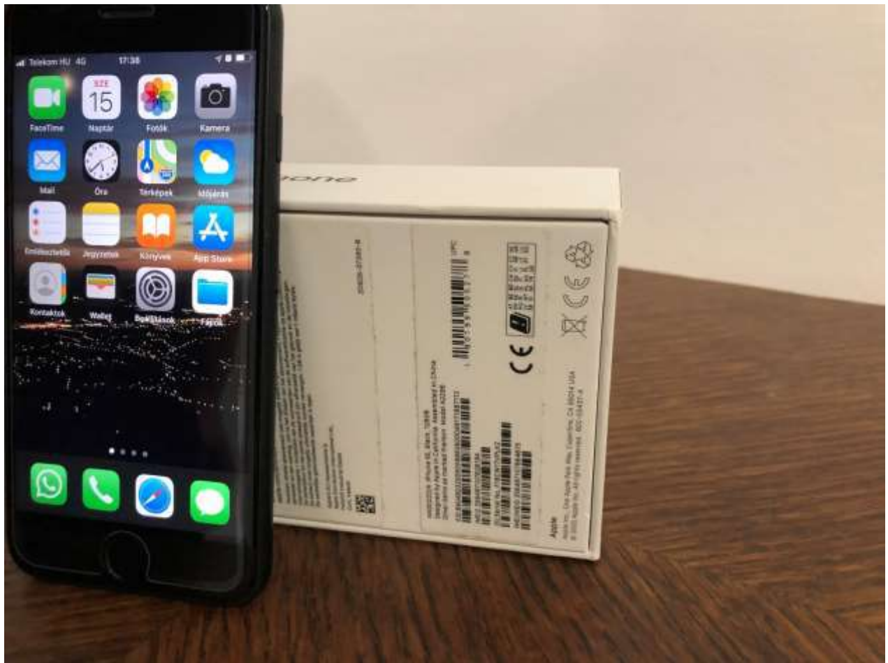
Apple iPhone SE 128 GB okostelefon