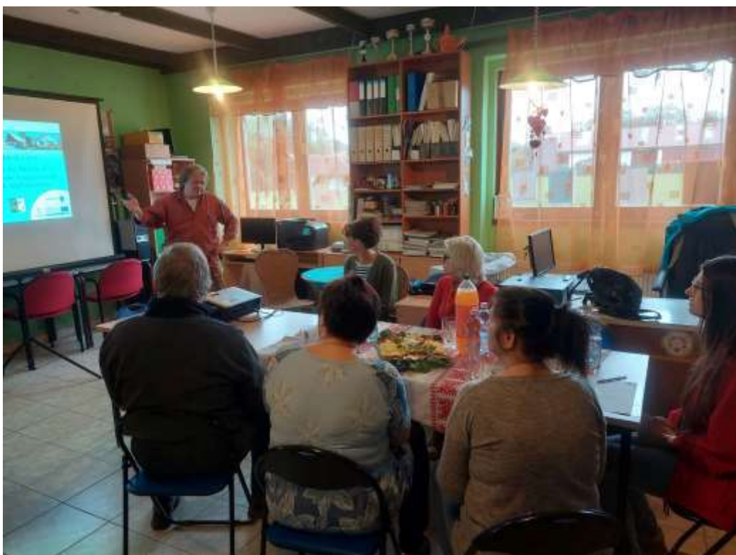
2022.04.27. Szakmai találkozó Somogyapáti