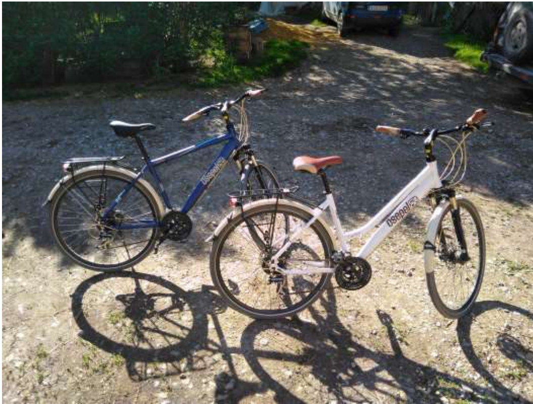
Csepel Traction 300 férfi-női kerékpárok