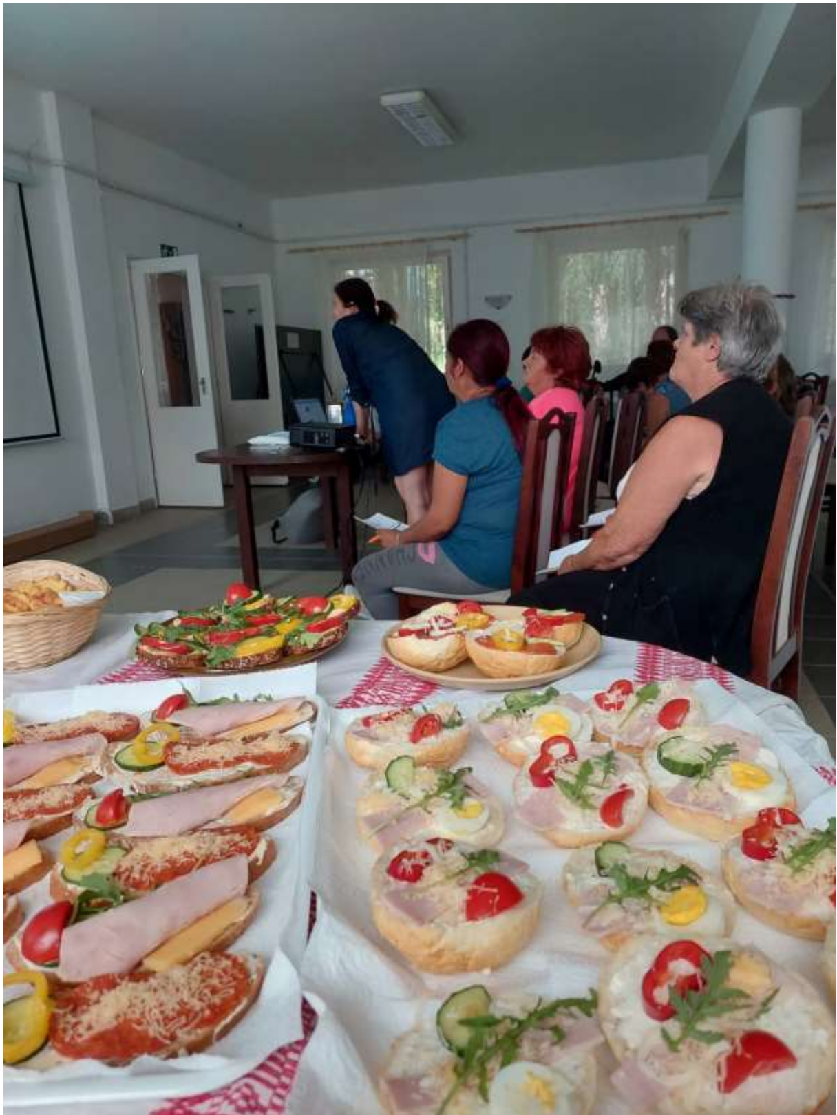
2022.08.01. Marketing workshop