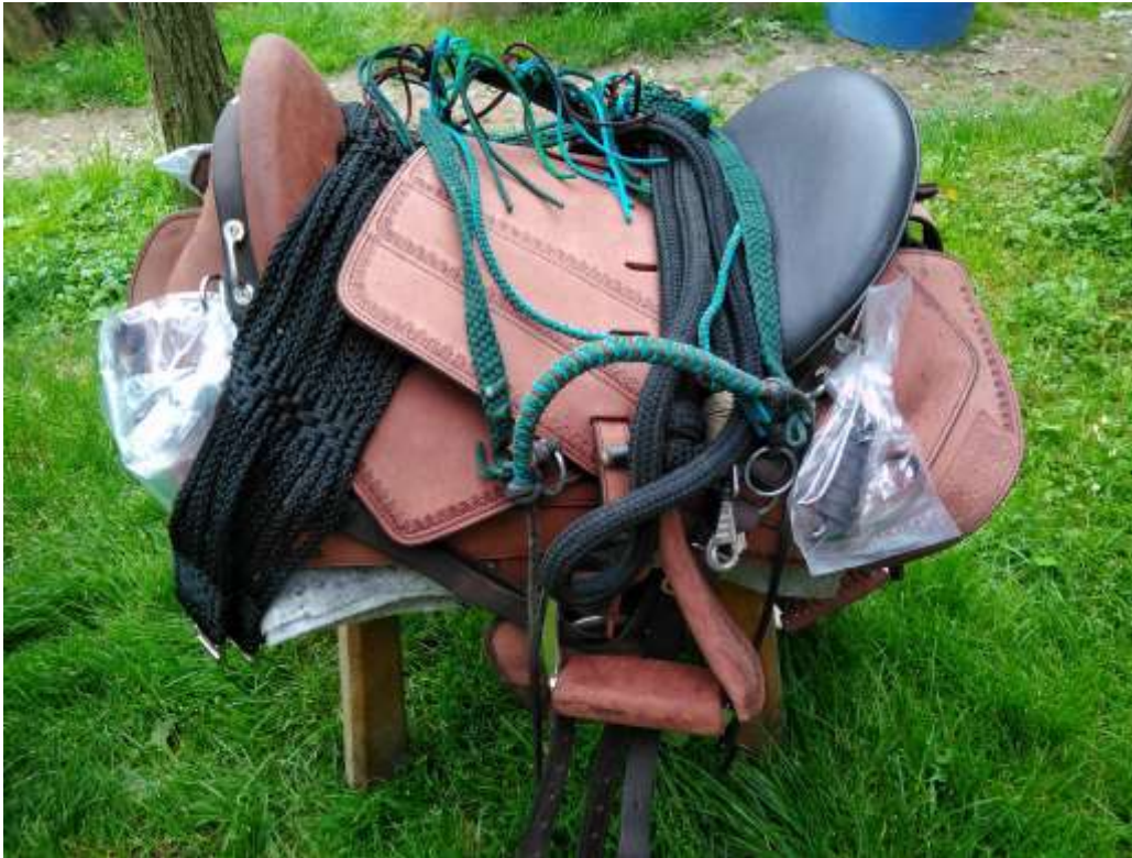
Escape fouganza túranyereg szett 2.