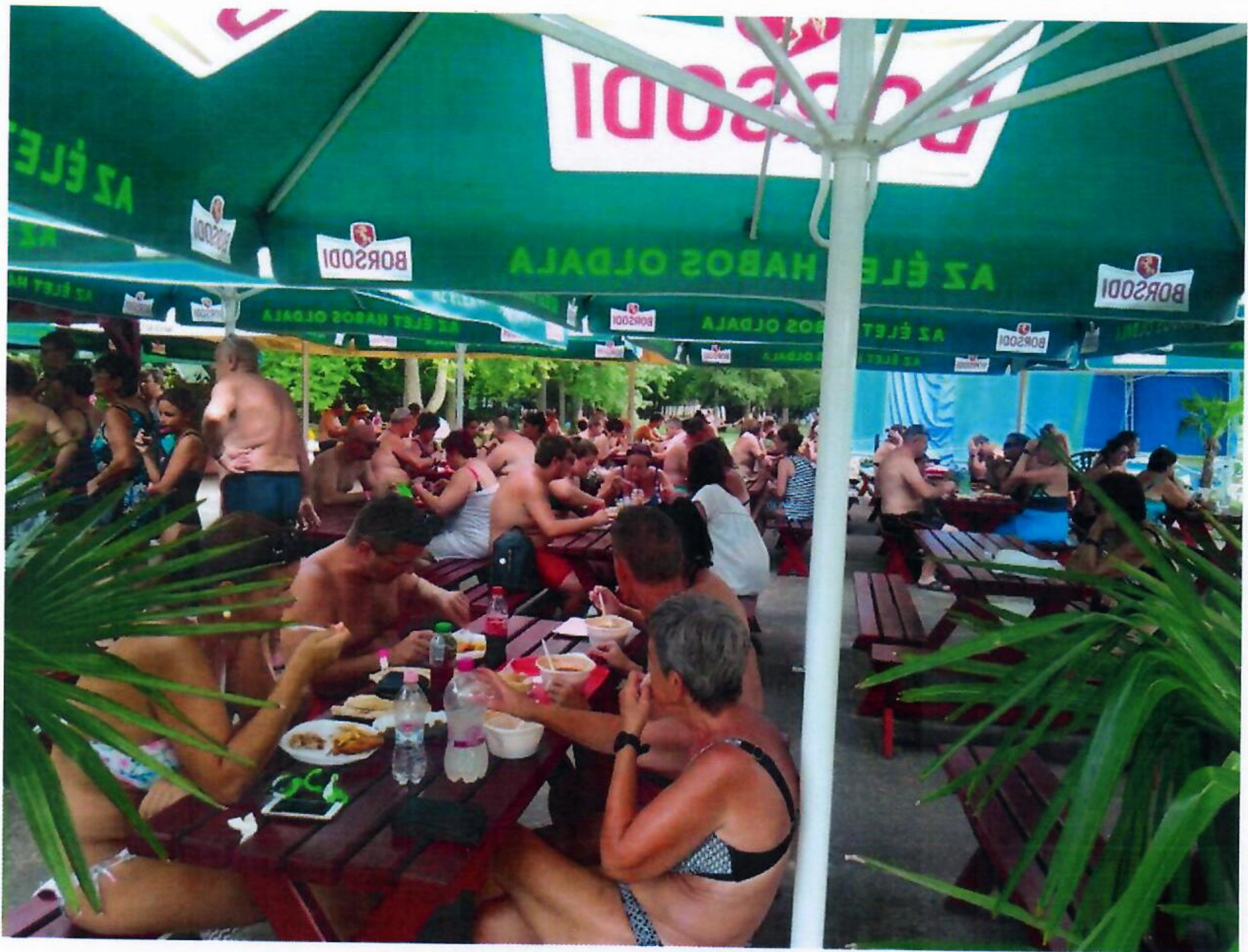
2020.08.01.Étkezés szabadon levásárolható étkezési kuponokkal