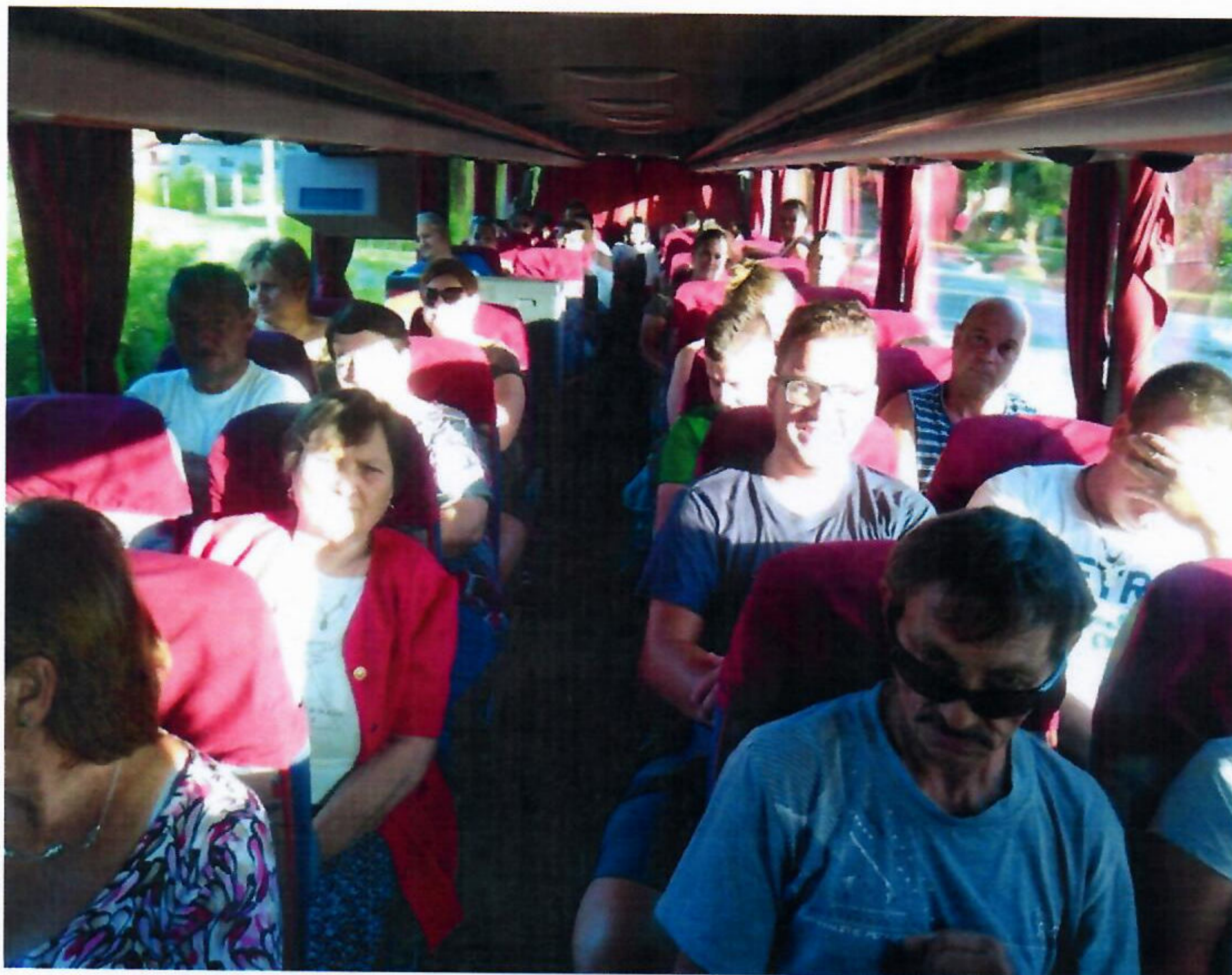
Hazautazás Gunarasfürdőről 2020. 08. 30.