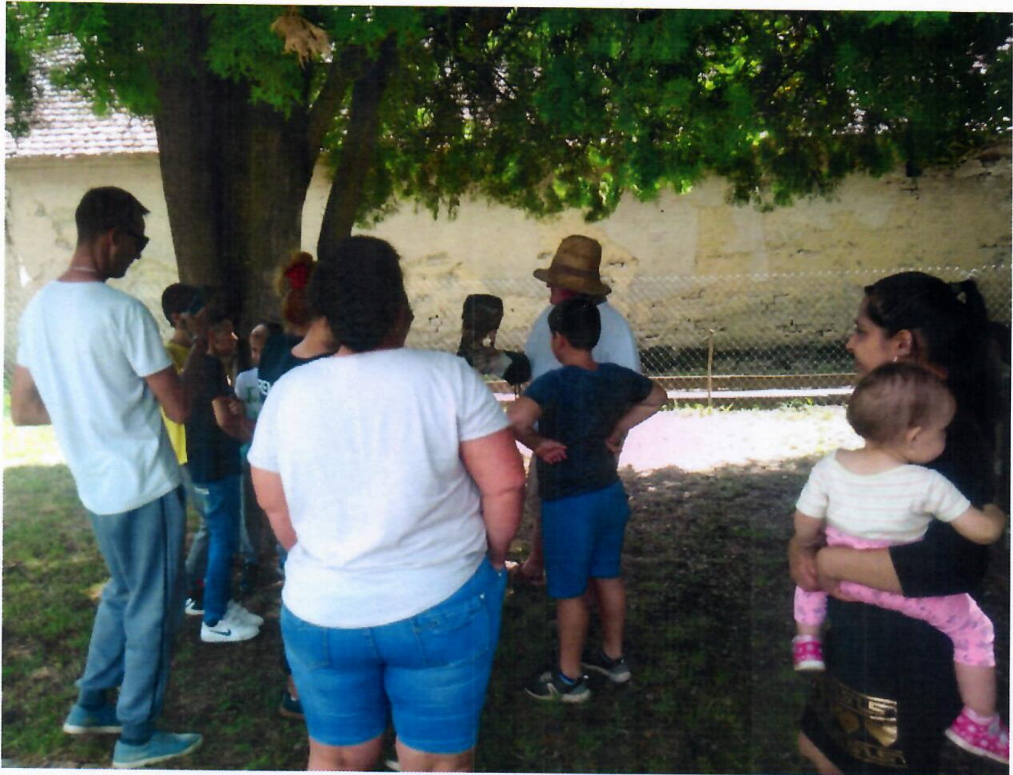
2020.08.30. Természetismereti és solymász előadás, ragadozómadárral

Az egy darab, DJ-14 BT DJ PA szett PA erősítő + BT keverőpult, 2 x hangfal, karaoke mikrofon szett beszerzésével lehetőség nyílt a közösségi programokon minőségi szolgáltatásokat nyújtani a különböző generációnak.