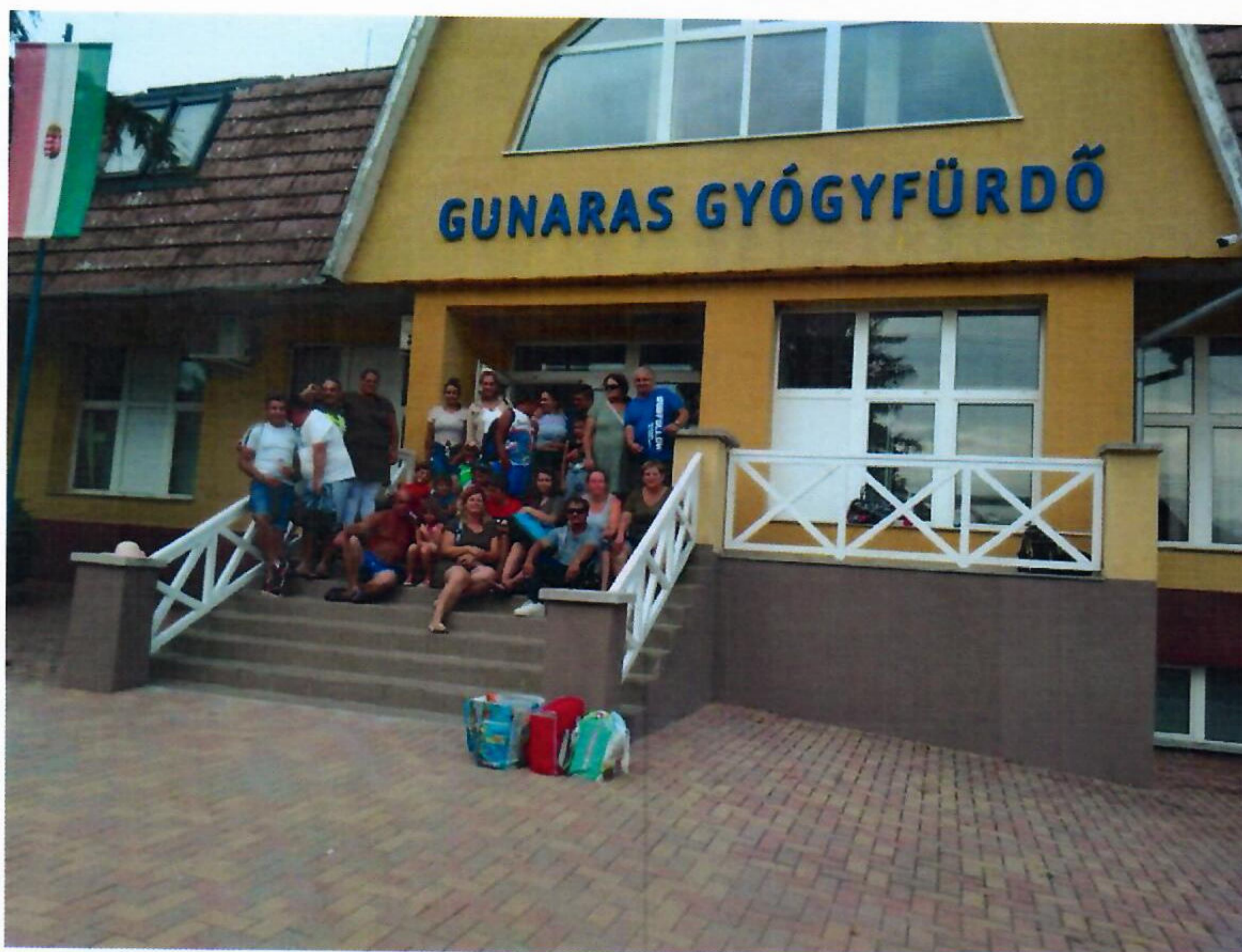
2020.08.01. Gunaras Gyógyfürdő látogatás után