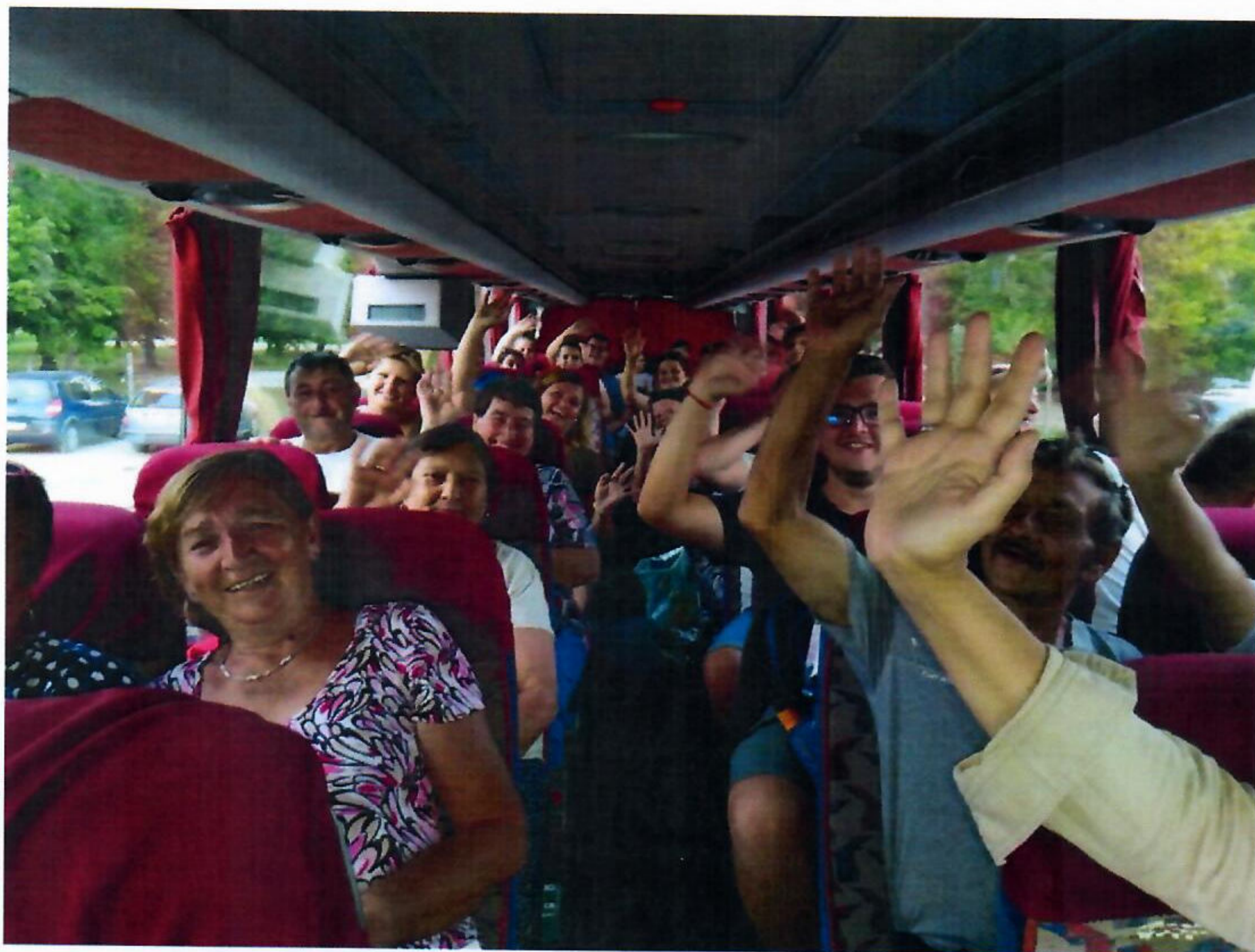
Hazautazás Gunarasfürdőről 2020. 08. 30.