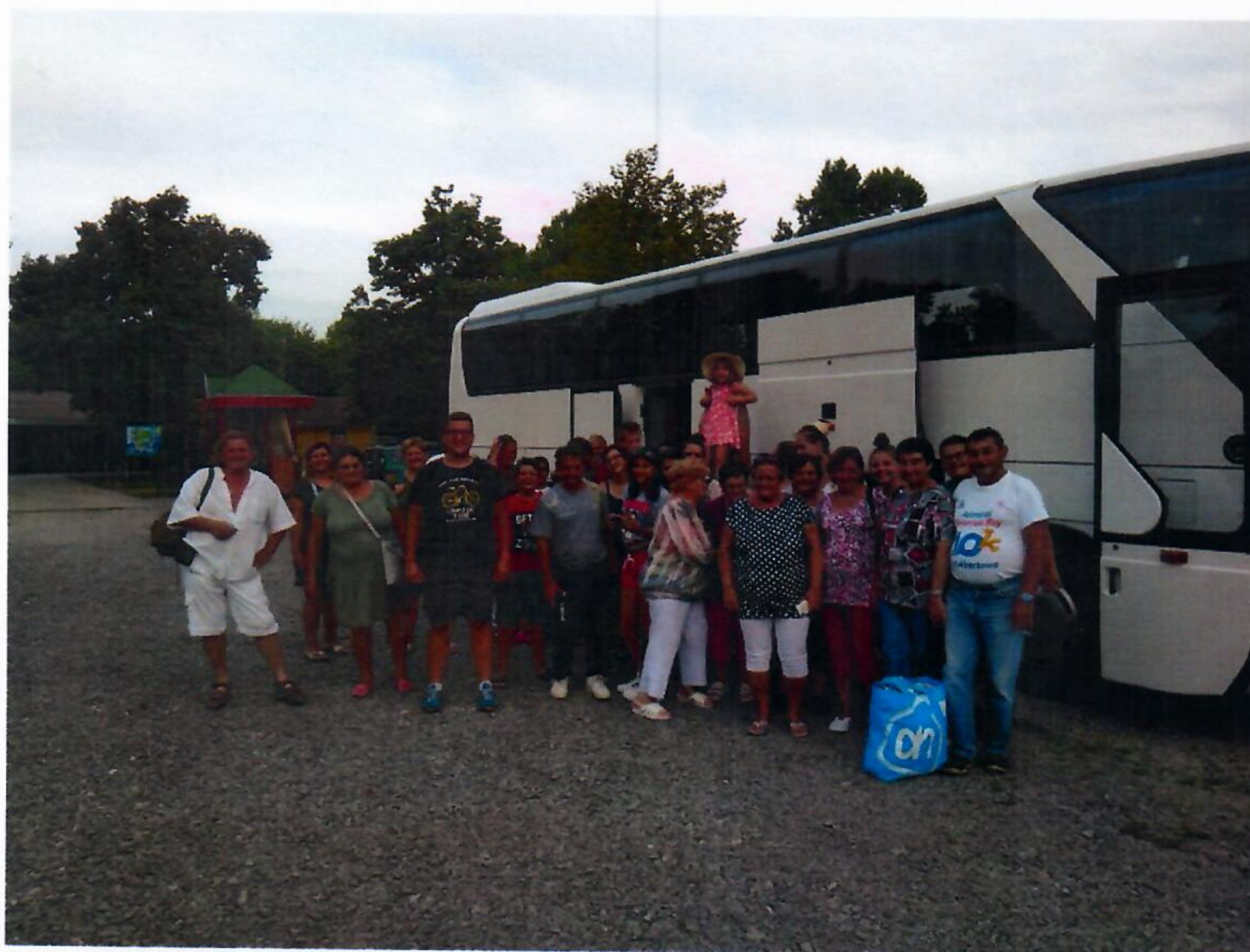
2020.08.01. Hazautazás Gunarasfürdőről