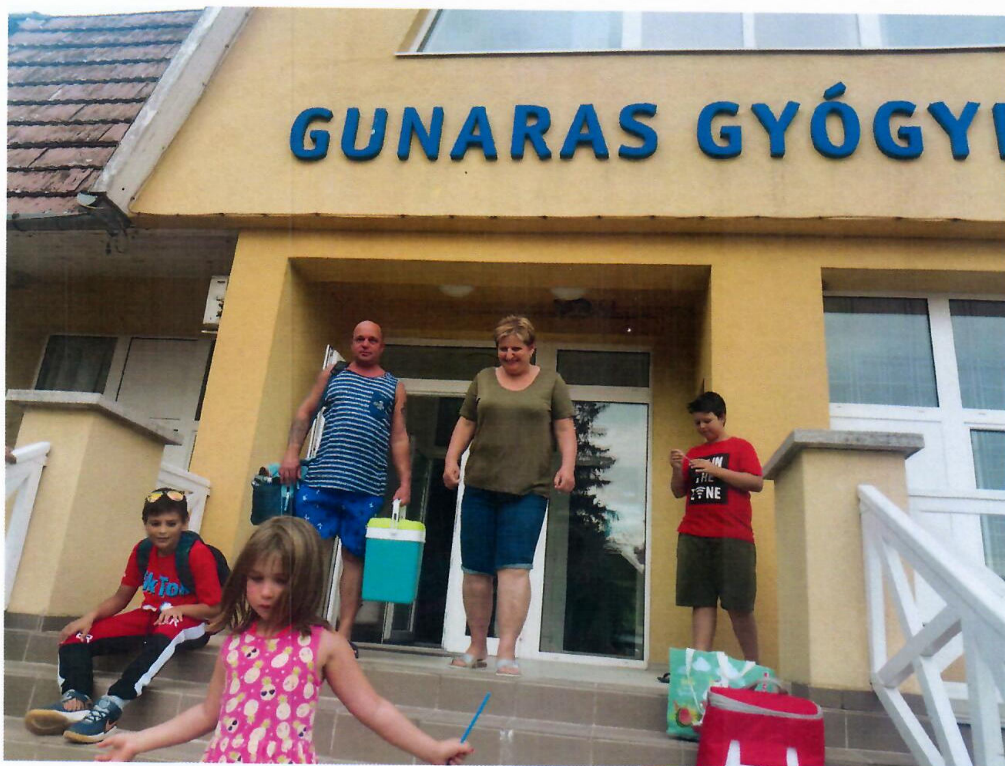
2020.08.01. Hazautazás előtt gyülekezés