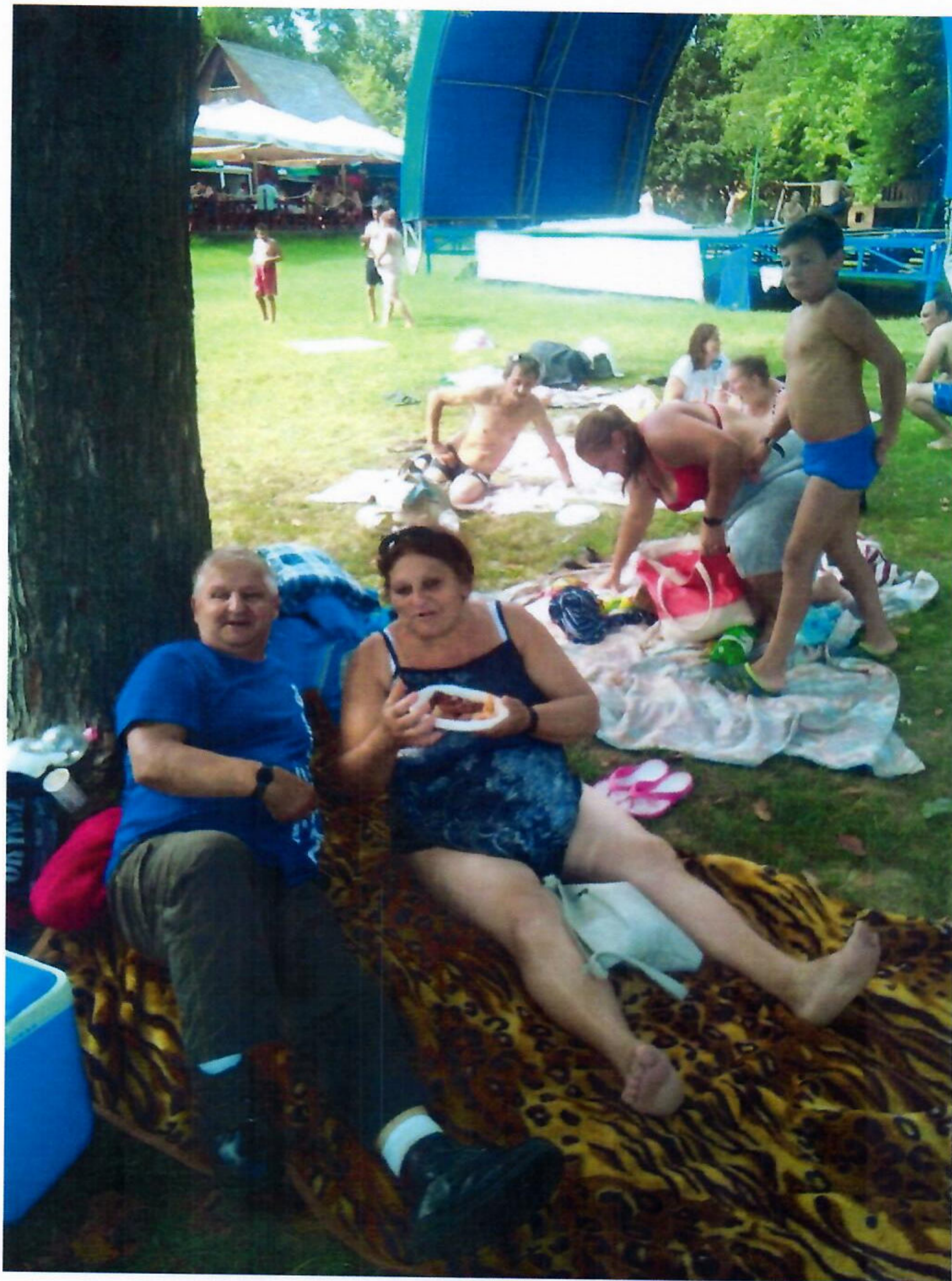
2020.08.30.Közös táborhely a strandon