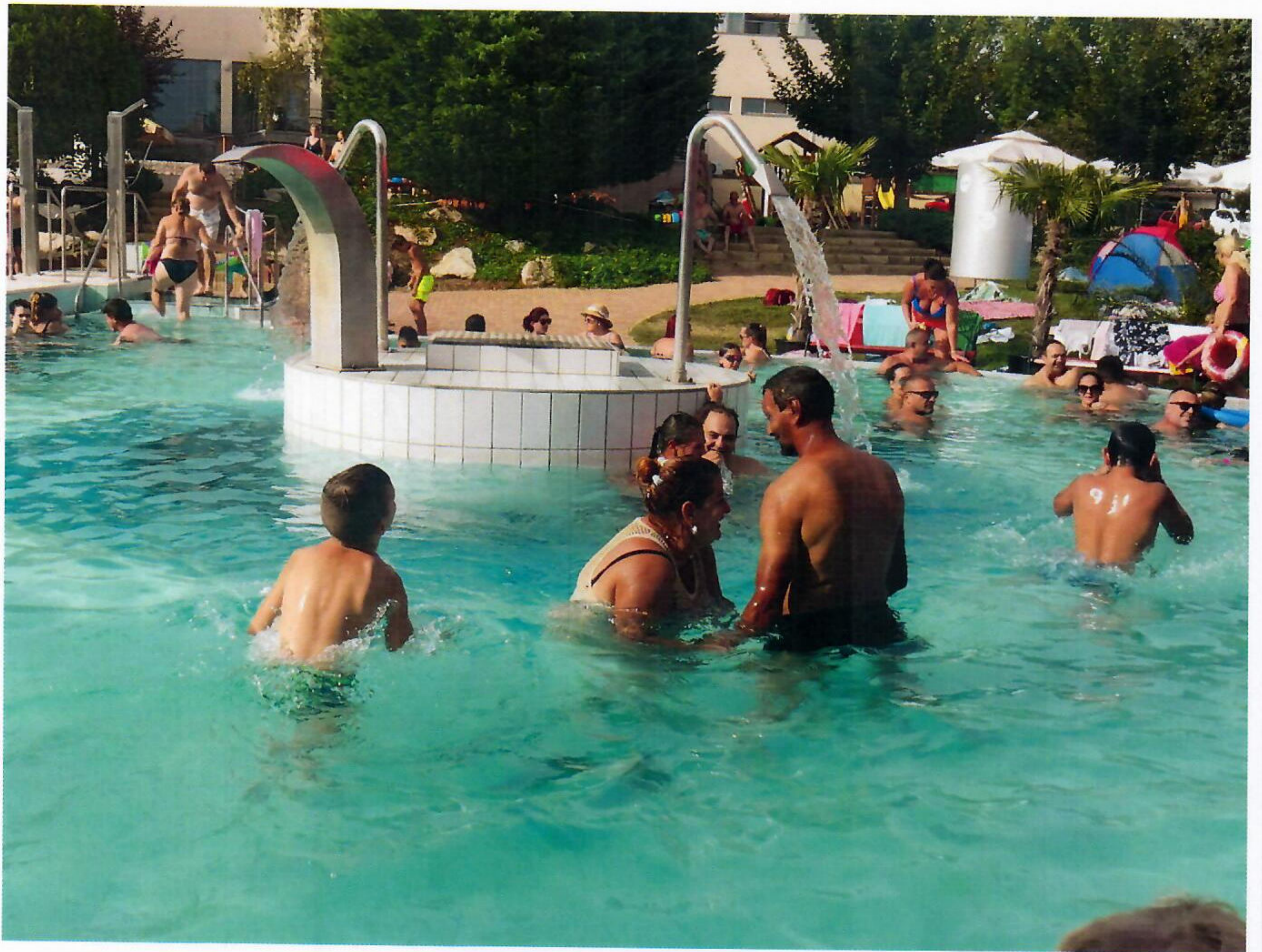
2020.08.01. Családok a fürdőben