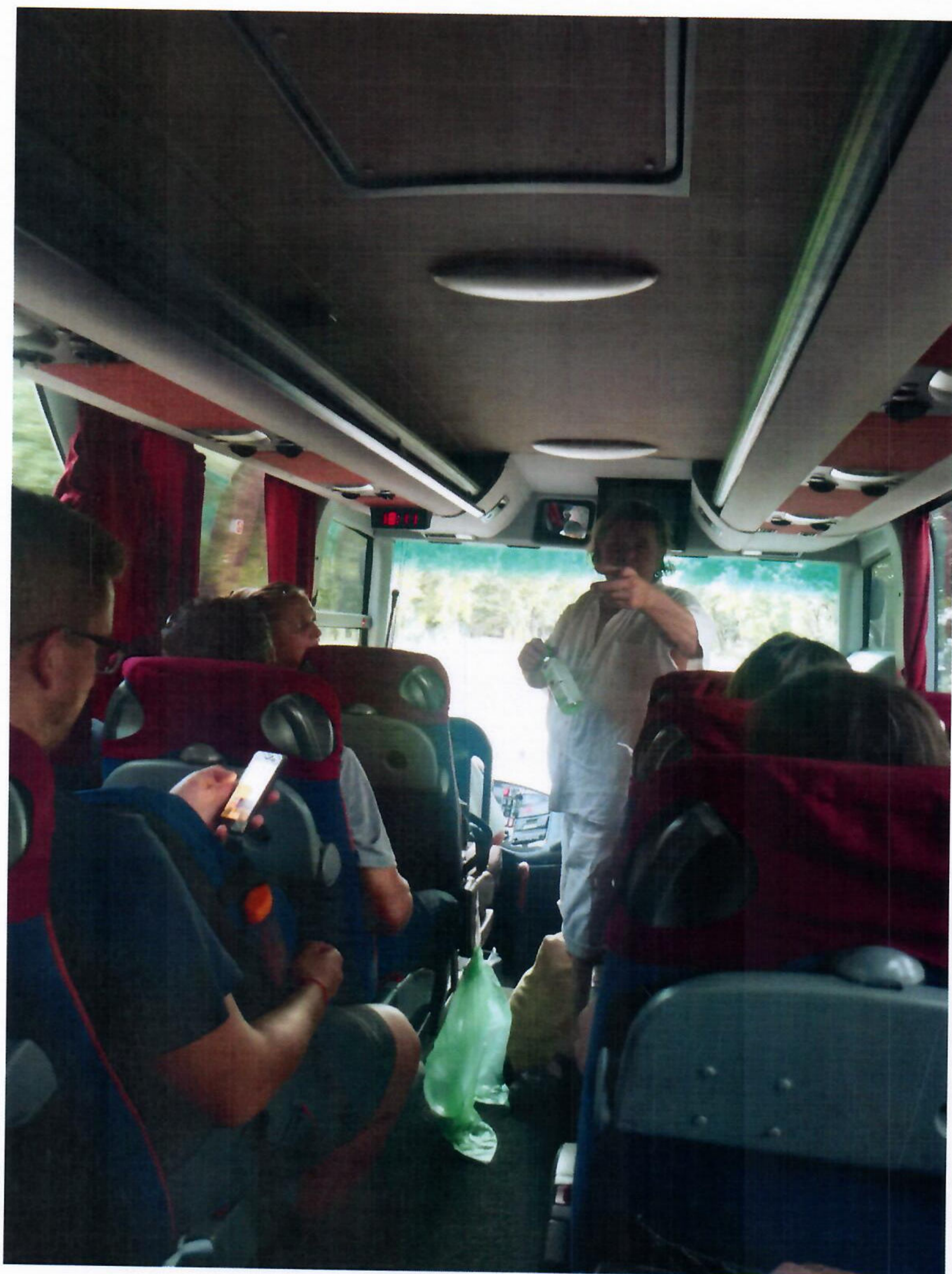
2020.08.30. Utazás Gunarasfürdőre