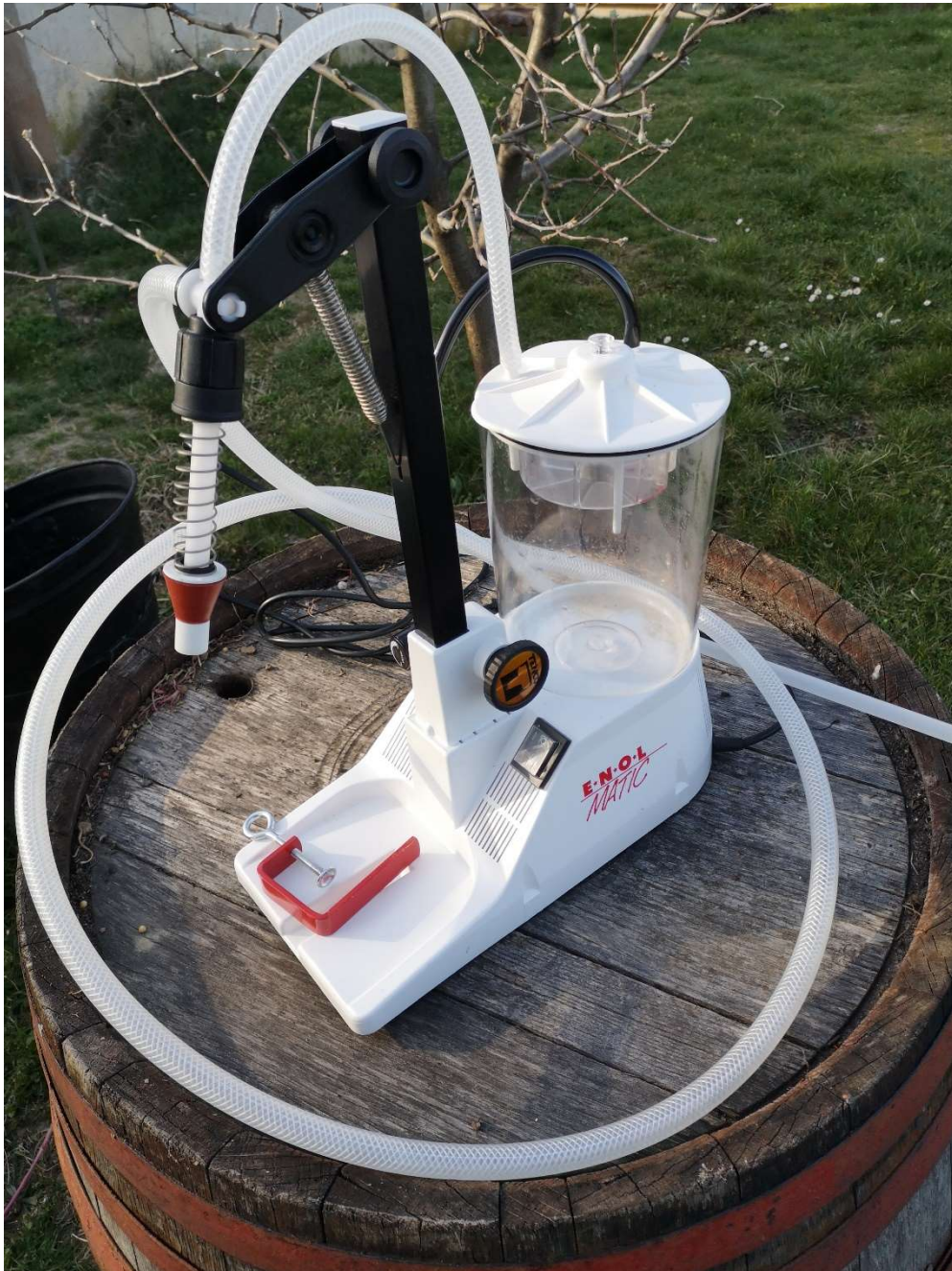
Töltőgép Enol Matic

Megvalósítási helyszín: 7932 Mozsgó Alsóhegy 000799/2