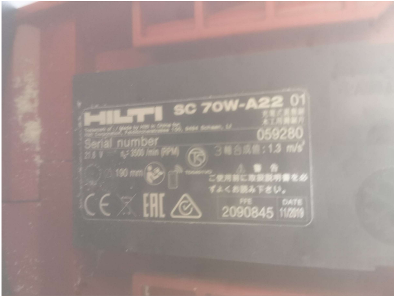
Hilti Akku-kézi körfűrész SC 70W-A22, gyári szám: 059280