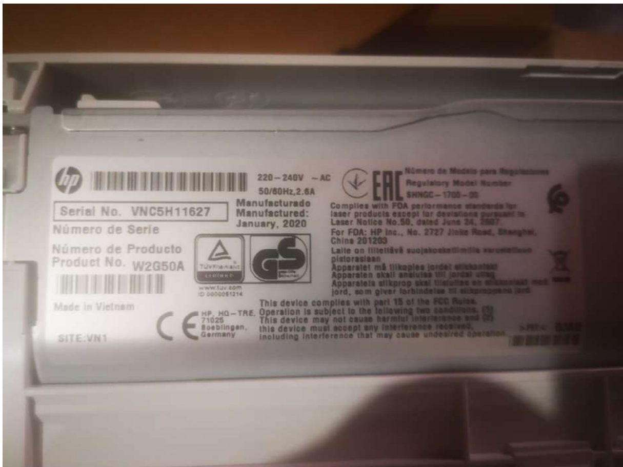
Nyomtató HP LaserJet Pro M15a, gyári szám: VNC5H11627