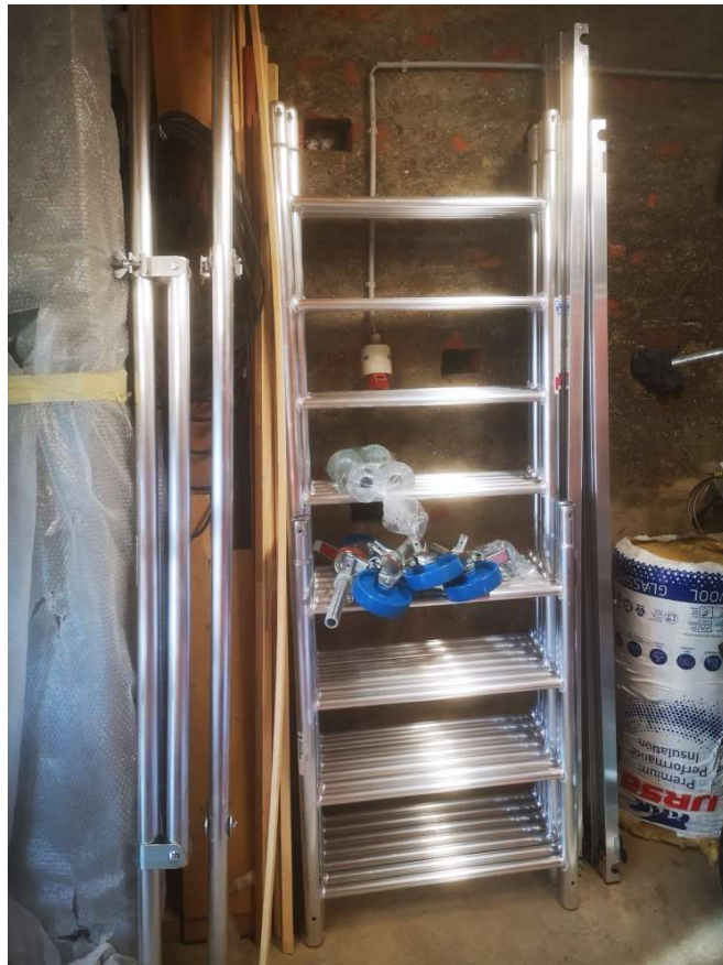
Krause Monto Protec Gurulóállvány 7, 3 m