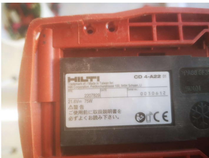
Hilti akku-kinyomókészülék CD 4-A22 doboz, patronfelvevő CD 4 310 ml, 600 ml, gyári szám: 0030612