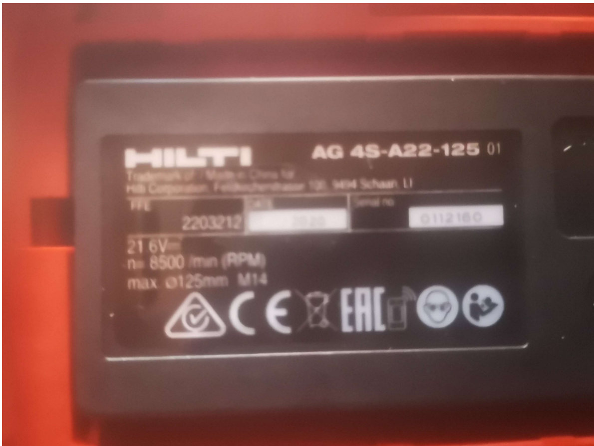
Akku-sarokcsiszoló AG 4S-A22-125, gyári szám: 2203212