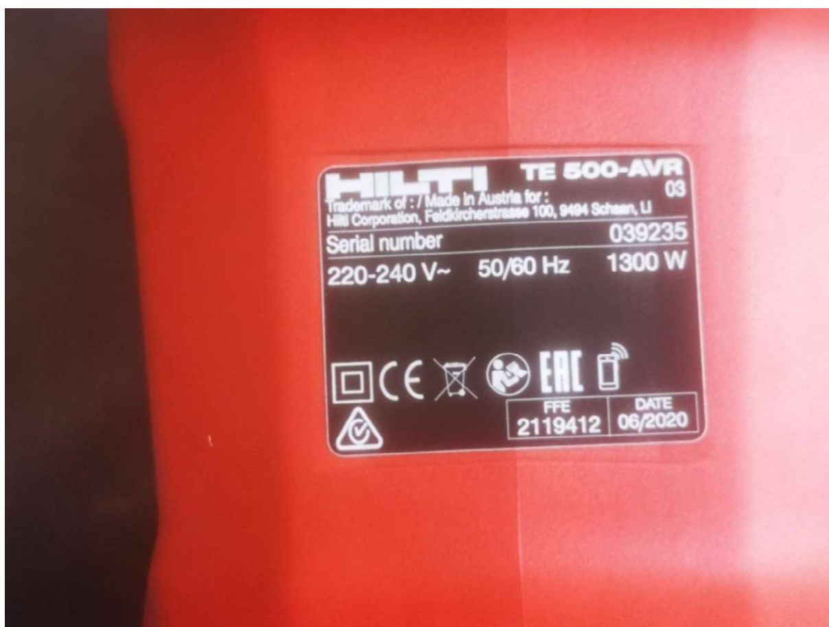
Vésőkalapács TE 500-AVR, gyári szám: 039235