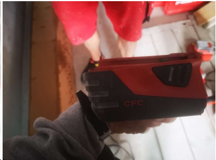
Töltő akkumulátorral B 22/5.2 Li-ion, gyári szám: 007320086