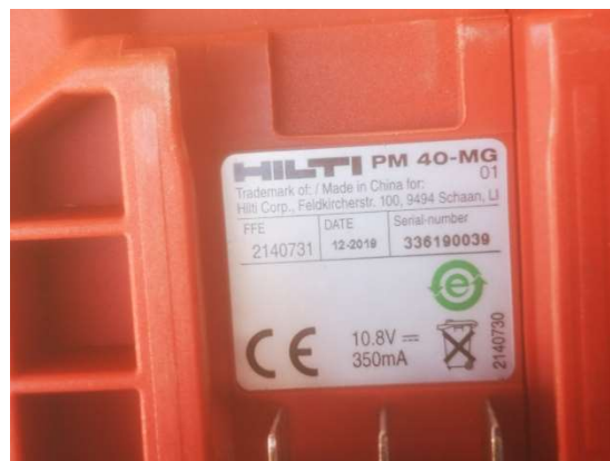
Hilti Szett PM 40 MG + PMA 31G + PMA szintezőlézer, gyári szám: 336190039