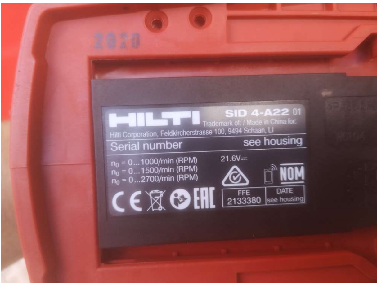
Ak. ütvecsav. bit-fej. SID 4-A22, gyári szám: 200071287