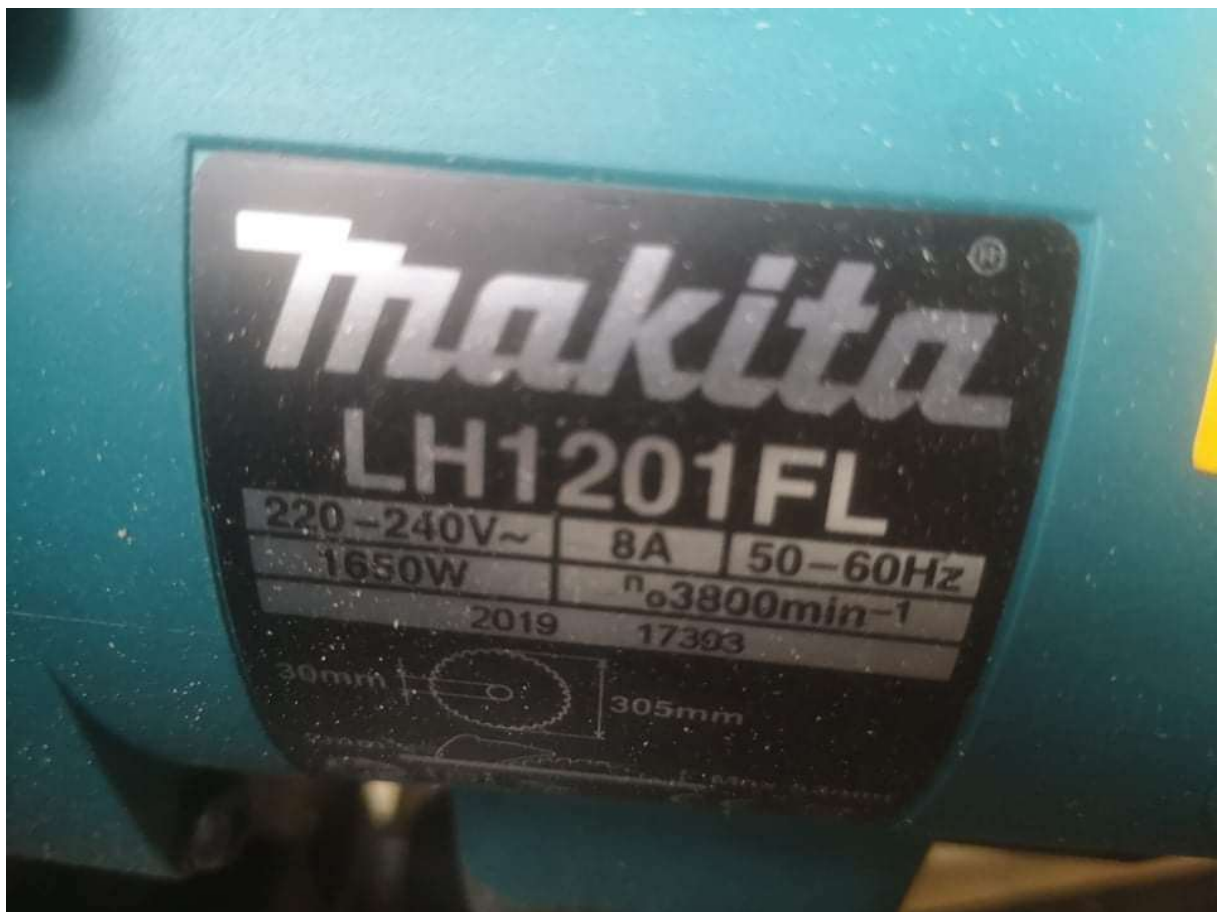
Makita LH1201FL kombinált gérvágó, gyári szám: 17393