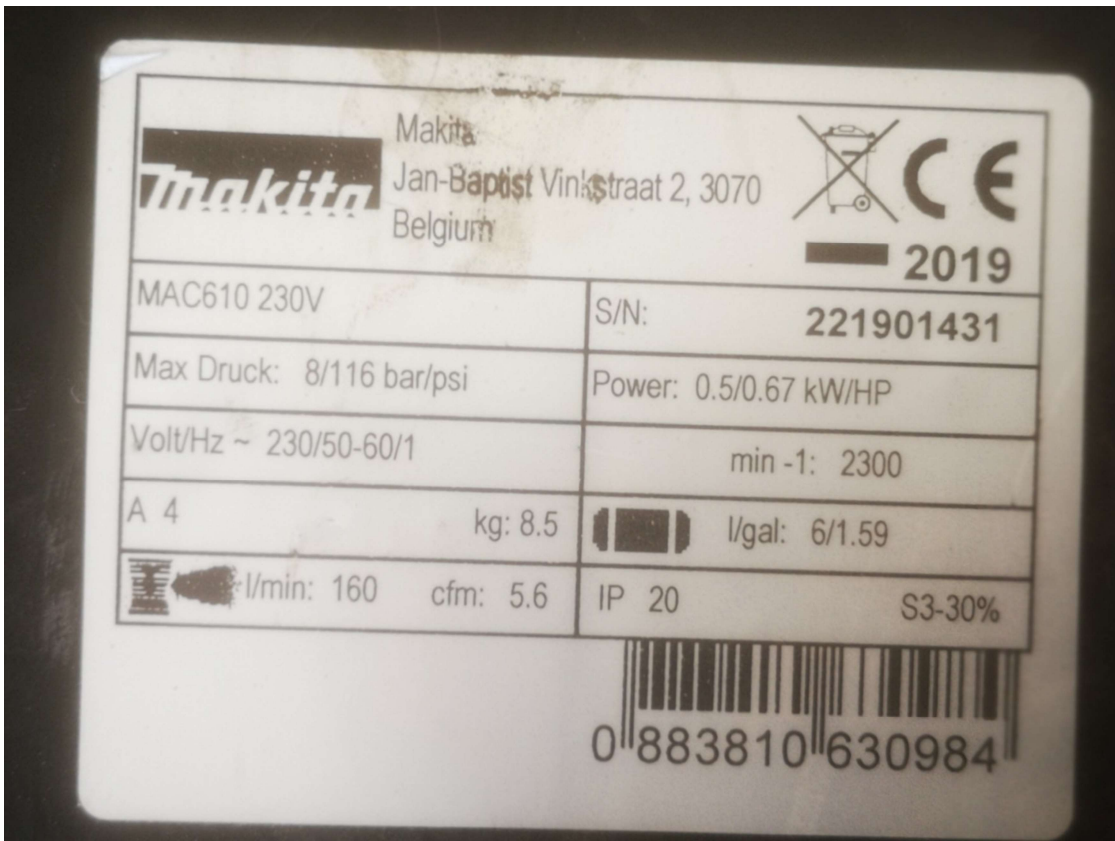
Makita Mac610 kompresszor, gyári szám: 221901431