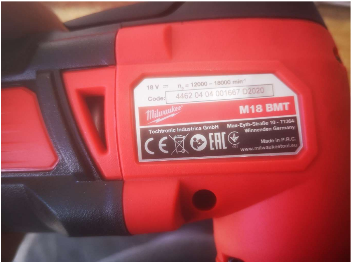
Milwaukee M18 BMT-0 kompakt multi-tool, gyári szám: 44620404001667D2020