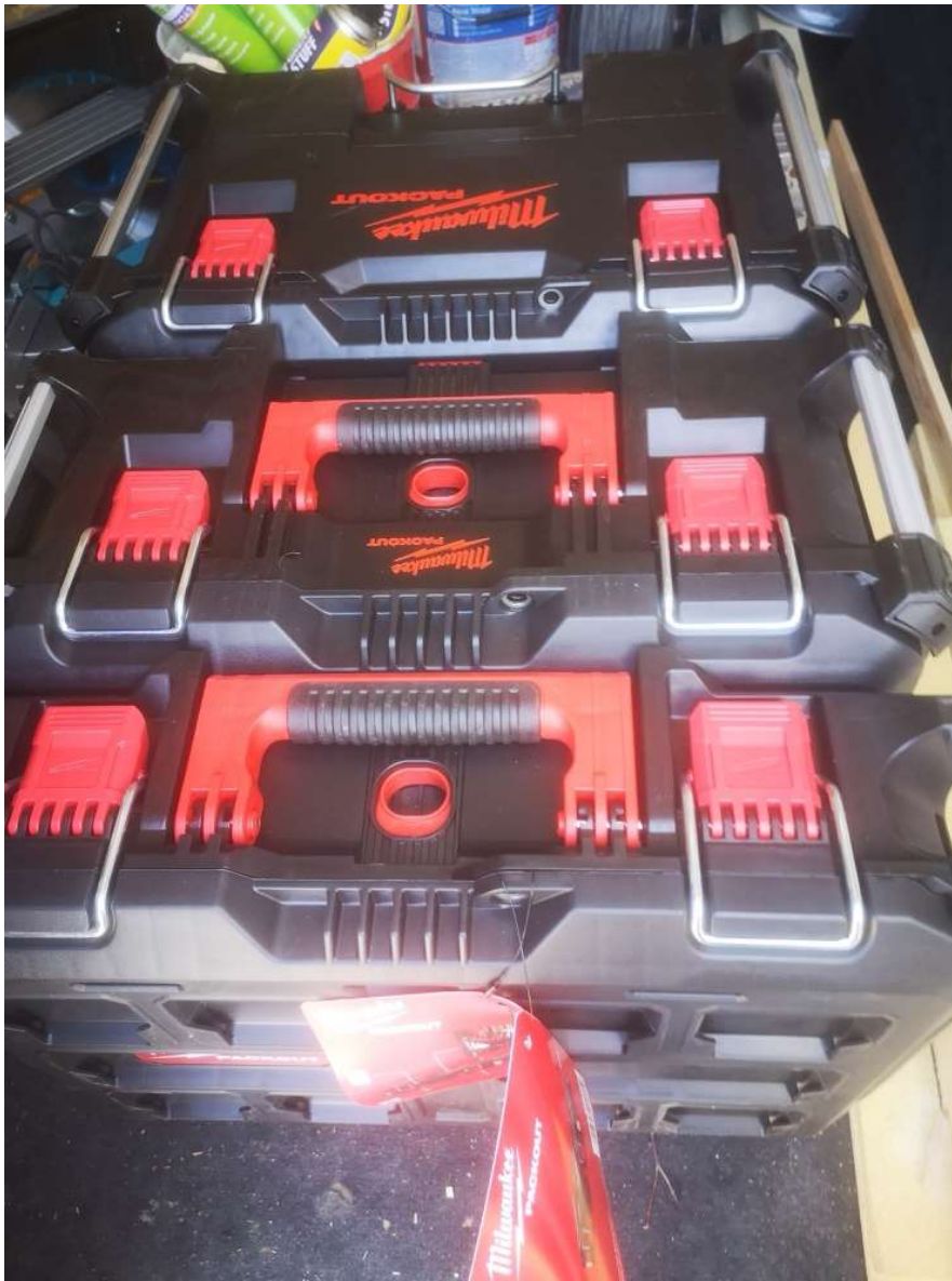
Milwaukee Packout TM Szett 123