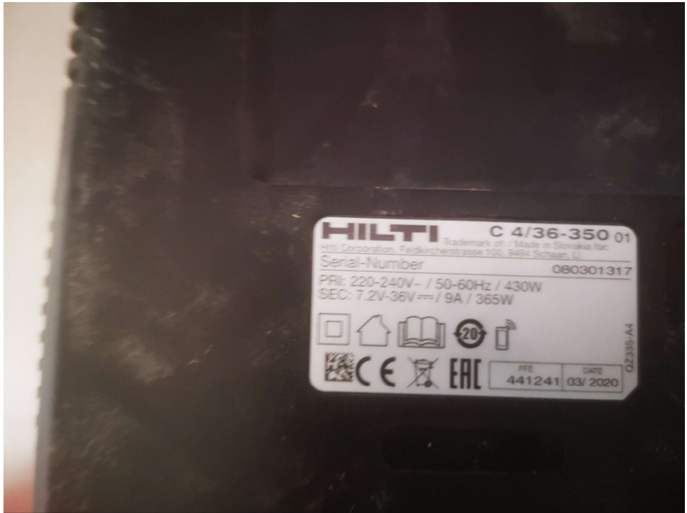
Töltő akkumulátorral C 4/36-350 V, gyári szám: 080301317