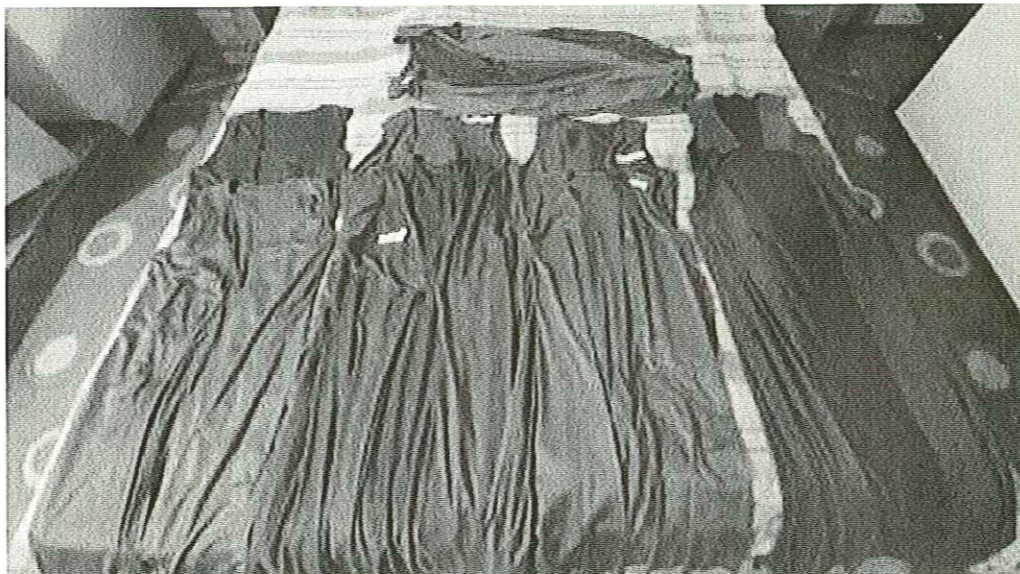
Férfi ing – 1db