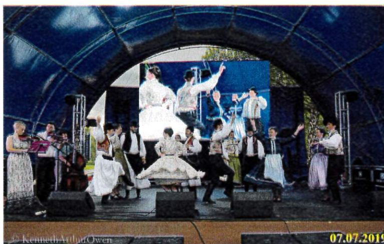
Mecseki Táncgyűttes fellépése