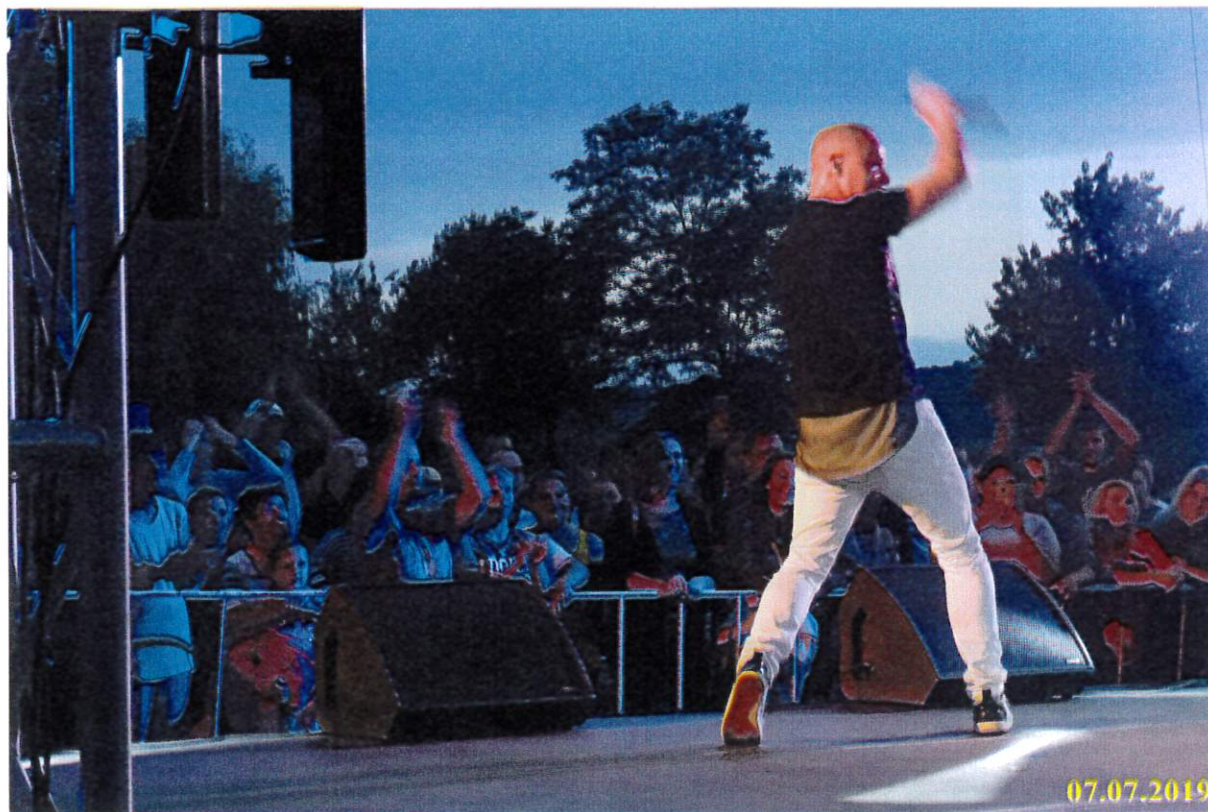
Kozmix - könnyűzenei sztárfellépő élő koncertje

A fenti műsorokkal a térségi rendezvényünk színvonalát tudtuk emelni.