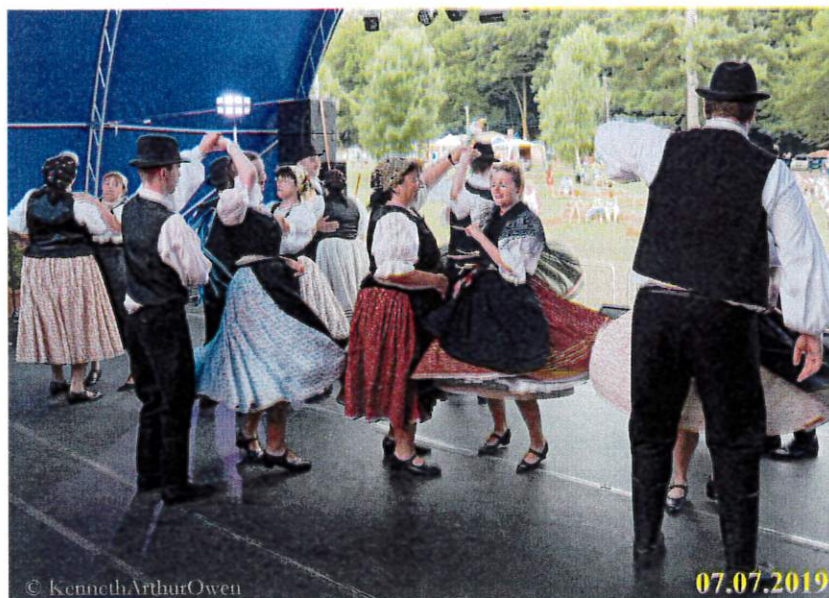
Kozármislenyi Néptáncgyűttes fellépése