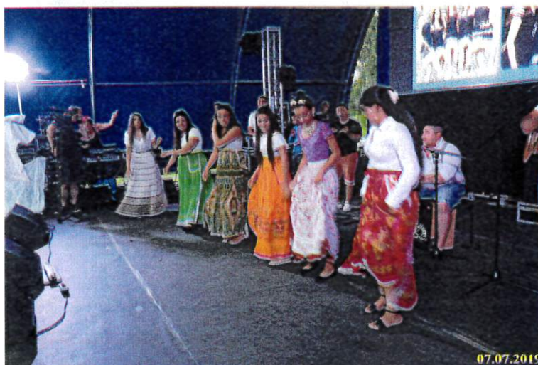
Mecseki Táncgyűttes – Cigány-folklór