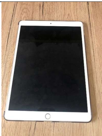
1 db iPadPro 10.5 hüvelykes 64 GB

rendelő, nagyobb vállalkozások, magánrendelések stb.) kerültek kihelyezésre. Promóciós termékek is készülnek a cég logójával, termékeivel stb, ezek a már említett névjegykártyák, mappák, jegyzettömbök és tollak. A projekt készütségi foka 100 %. A projekt hiánytalanul megvalósításra került.