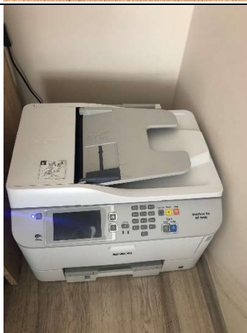
1 db EPSON- WORKFORCE PRO- WF- 5690DWFnyomtató