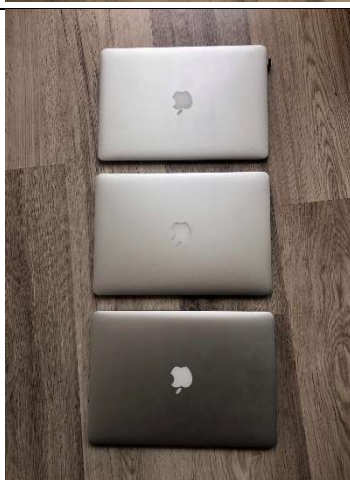
3 db Apple MacBook Air 13 MQD32MG/A